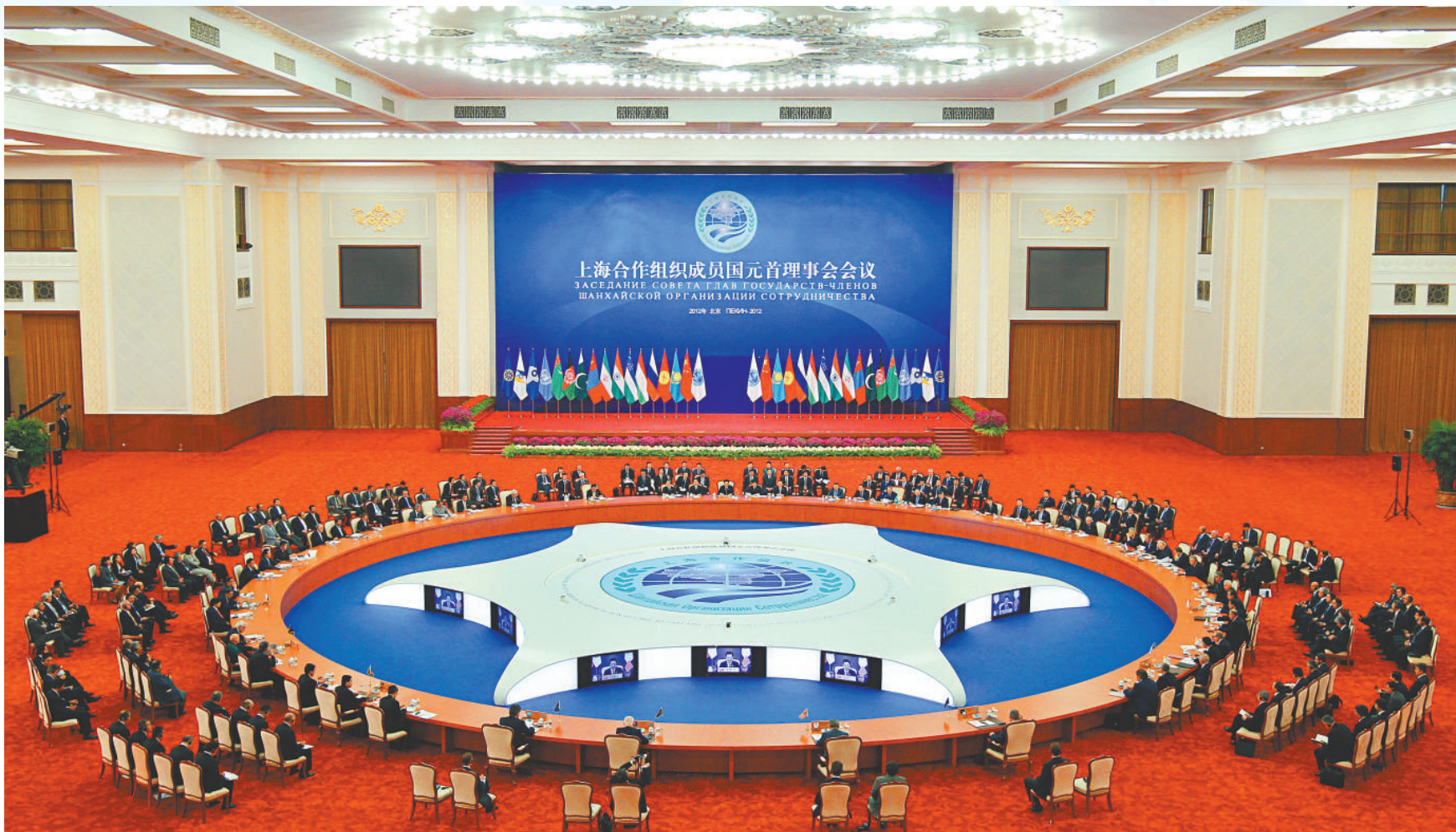
▲上海合作組織成員國元首理事會第十二次會議大範圍會談七日在北京舉行。專家指出，本次峰會全面規劃組織未來發展，是一次承前啓後、繼往開來的重要會議，體現了上合組織不斷創新、積極拓展、深化合作、面向未來的廣闊發展前景

各方高度評價中方為推動上海合作組織發展作出的重要貢獻，相信本次峰會將成為本組織發展歷程中新的里程碑。