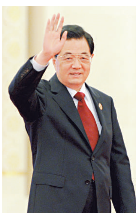
▲胡錦濤七日在上合峰會發表重要講話，就上合組織未來十年發展提出四點建議