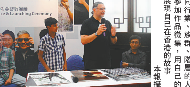
▲不同行業、族群、階層的人都可參加作品徵集，用自己的鏡頭展現自己在香港的故事