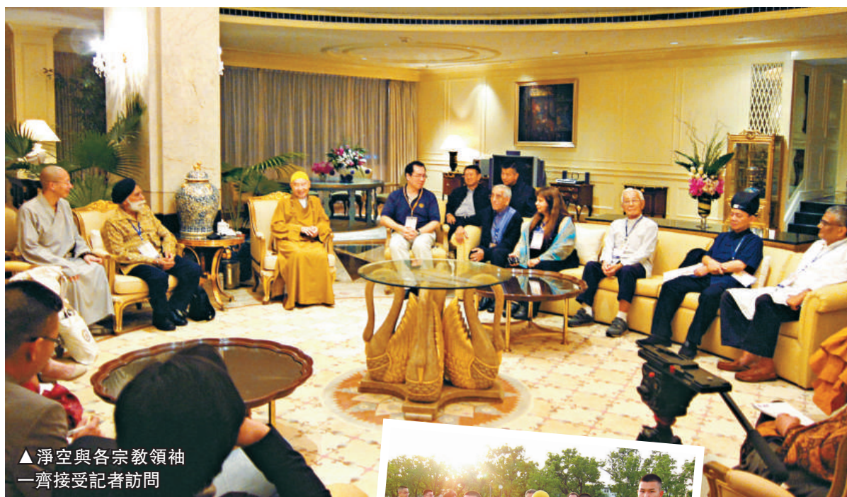
▲淨空與各宗教領袖一齊接受記者訪問