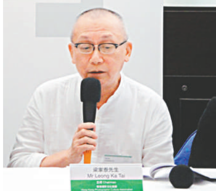
▲梁家泰希望計劃能達到層面廣，深度足