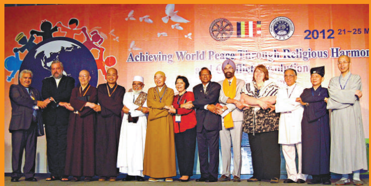
▲在高峰論壇開幕禮上，十大宗教領袖為世界和平祈禱及攜手合照

還參與了布施九十九名供僧的活動。參與人士又應邀往大王宮，出席王室舉行的慶祝活動，泰國王后 Sirikit 出席了活動，並接見淨空等宗教代表。