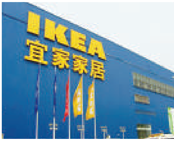
【本報訊】據英國《每日郵報》8日報道：瑞典家居巨頭公司宜家僱用了大批翻譯對其下9000種產品的名稱進行檢查，以確保他們在泰語中不代表什麼粗魯的意思。宜家在這個項目上花費了將近4年的時間，以避免讓泰國鬧尷尬。

據稱，宜家有一張名為「Redalen」的床，發音聽起來和泰語裡的上床非常相近，另外還有一個叫做