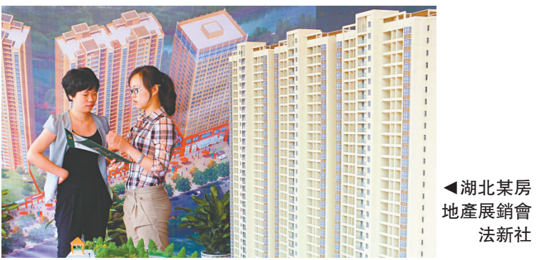
▲湖北某房地產展銷會

唐建偉認為，通脹的回落為貨幣政策提供了空間，考慮到未來外匯佔款增量下降因素，預計年內準備金率將調下1至3次，每次降幅料維持0.5%。至於年內進一步降息的問題，他直言，「可能性不大」，目前存貸款基準利率已處中性水平，鑒於2012年全年通脹水平同比料在3.3%左右，若再度降息將重返「負利率」時代，另一方面，三季度GDP將企穩回升，因此當局不必再度降準，但若外圍因素對國內經濟環境造成較大衝擊，不排除央行在下半年降準1次的可能。