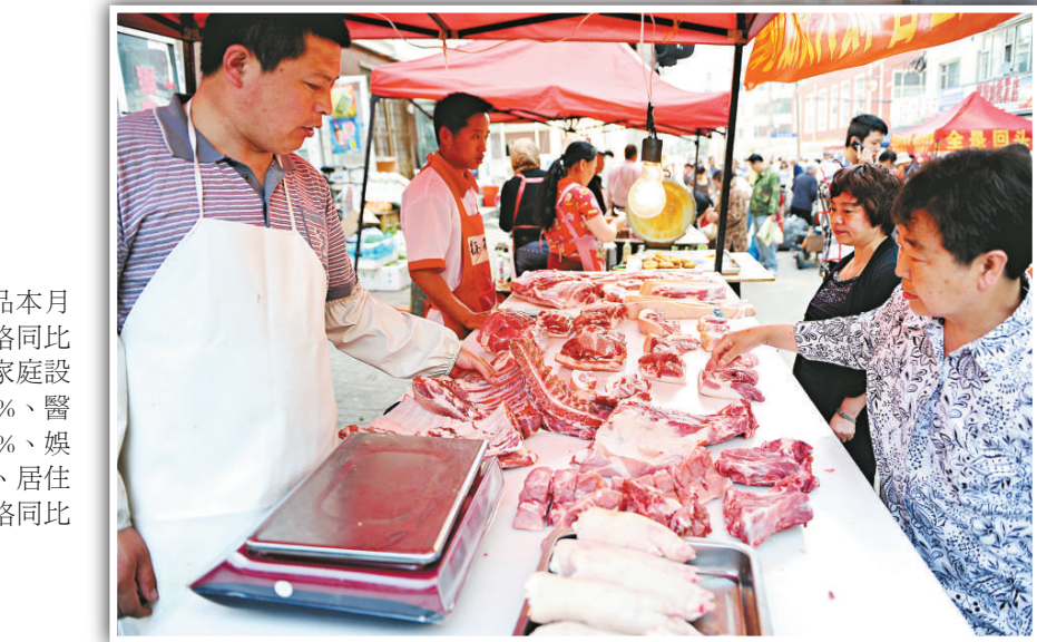
▲肉價終於下降，圖為市民9日在長春市建設街早市上購買豬肉