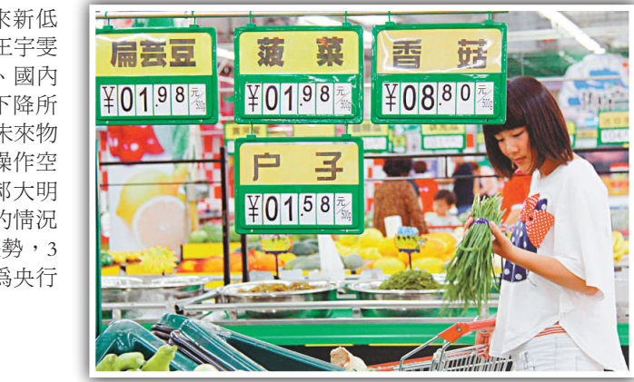
▲顧客在山東省臨沂市郯城縣一家超市選購蔬菜