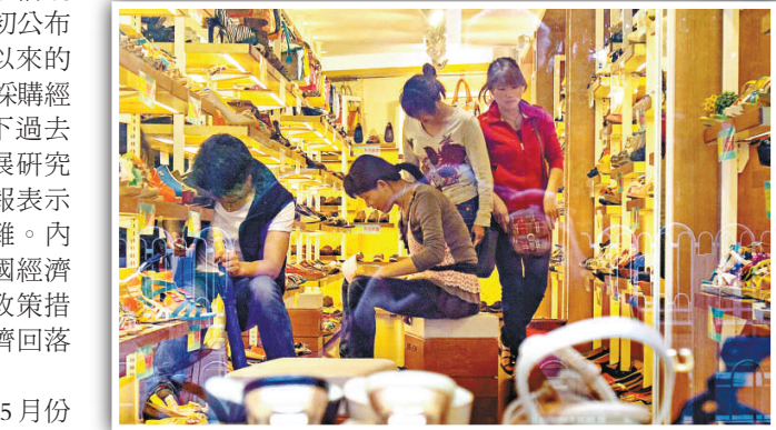
▲顧客在上海一家鞋店內選購鞋子