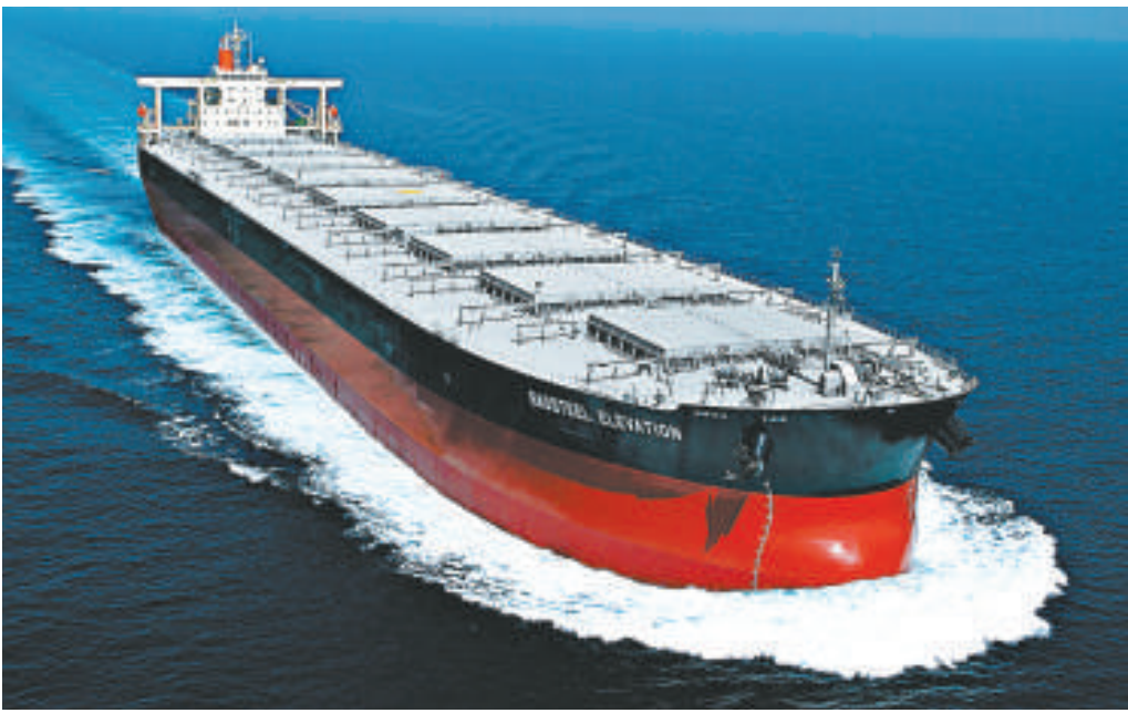
◀商船三井海岬型船

船，昨日就如何經營船隊均發表聲明表示，計劃暫時減少海岬型船舶運力，或閒置或拆解。川崎汽船發言人 Aral 昨日接受傳媒電話採訪時表示，航運市場低迷，公司根據市場形勢，計劃減少運力。針對船舶閒置計劃的細節問題，他沒有予以回應。但他肯定地表示，川崎公司沒有拆解計劃。日本郵船發言人 Tanida 亦表示，其公司將以拆船和閒置形式減少海岬型船隻運力，以降低成本。他並沒有透露具體的船舶減少數量。