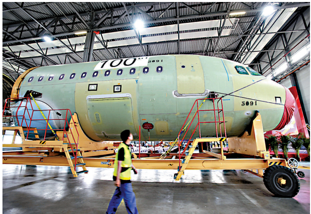
▲空巴天津總裝線交付第 100 架 A320 型飛機，機上標有「100」字樣

華航說，搭乘華航集團國際線班機的旅客，可在班機起飛前 3 到 24 小時內，透過「中華航空 App」辦理預辦登機及選位，在桃園、香港、法蘭克福、大阪、溫哥華、東京成田及羽田等機場，可直接下載使用電子登機證。