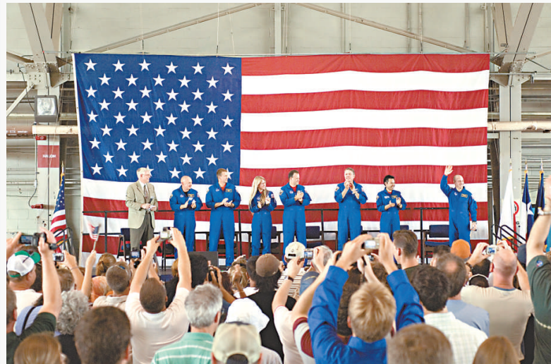
▲在美國，太空人是眾人偶像，每次完成任務回來，都受到熱烈歡迎 美國太空總署

美國太空總署表示，截至今年1月31日，最新一輪太空人招募共收到6372份申請，是繼1978年超過8000人申請當太空人之後，報名人數最多的