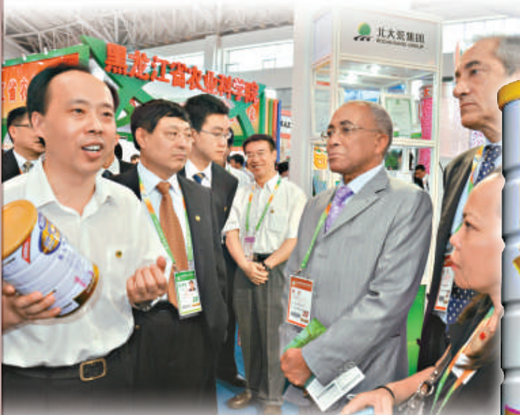
▲2011年哈洽會上，完達山人自豪地告訴外商：「中國的好奶粉在這裡！」