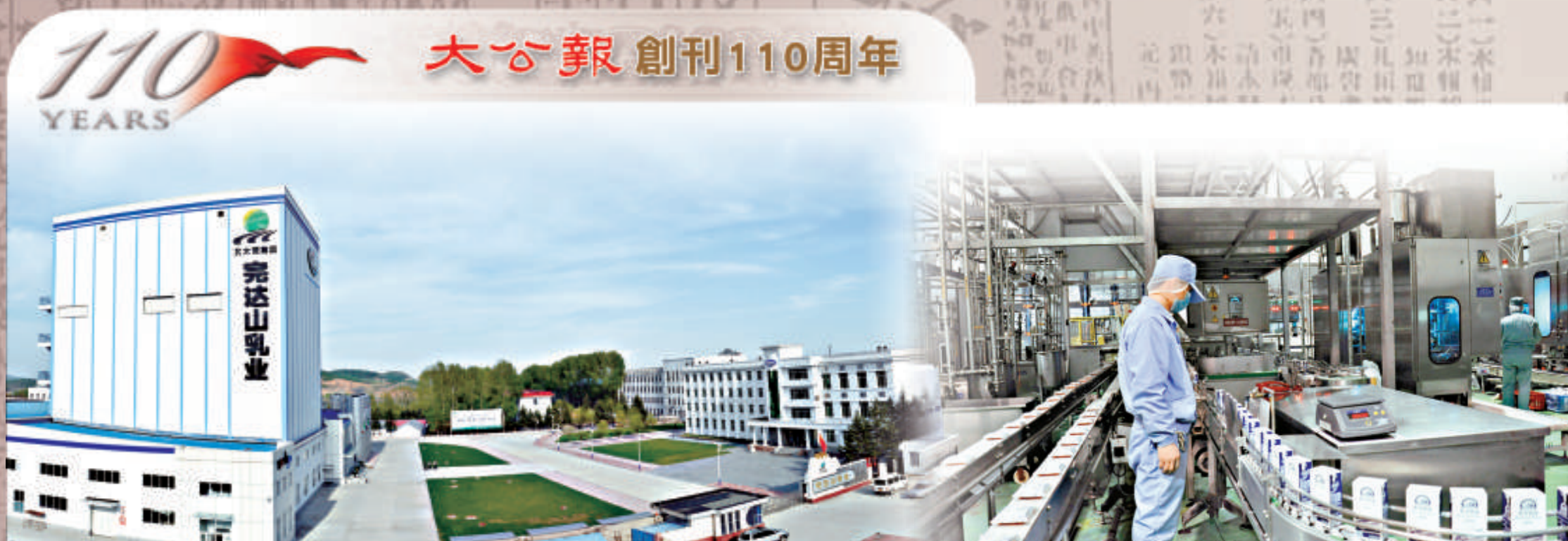
▲完達山品牌發祥地——以當年開發建設北大荒部隊番號命名的完達山乳業八五——分公司