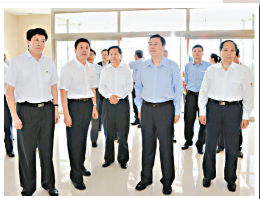
▲國務院副總理張德江(右二)，黑龍江省委書記吉炳軒(右一)、省長王惠魁(左三)，黑龍江省農墾總局黨委書記、局長隋鳳富(左二)，完達山乳業董事長王景海(左一)駐足於完達山乳業百米文化長廊

安力聰產品於2009年問世時，國內乳品企業與國外專業機構針對中國寶貴聯合研發的產品還很少，安力聰作為領先行業的高端奶粉，將在未來幾年進行重點培育與推廣，使其成為完達山乳業的明星產品。一方水土養一方人，相信安力聰奶粉將成為年輕父母最佳的選擇。