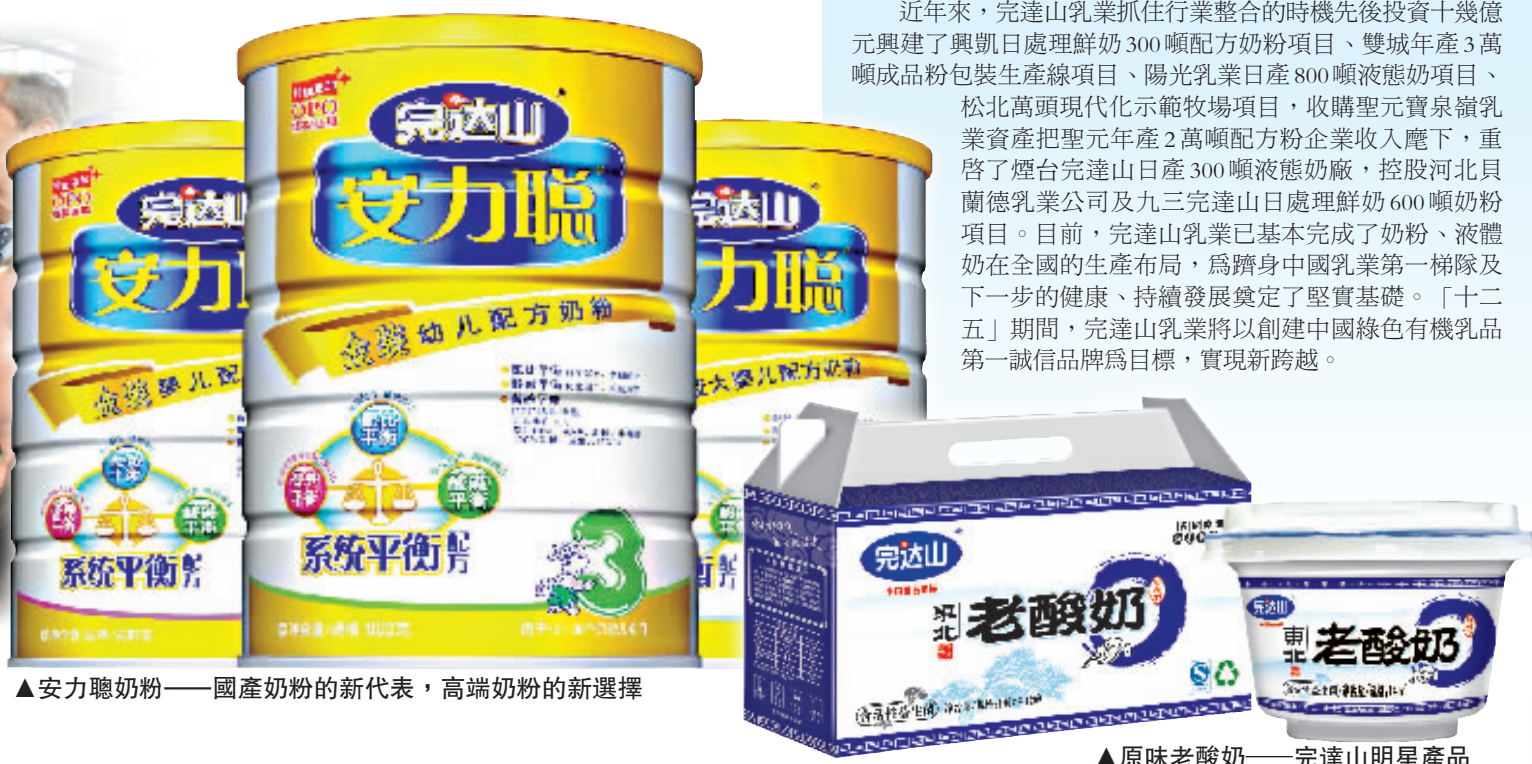
▲安力聰奶粉——國產奶粉的新代表，高端奶粉的新選擇