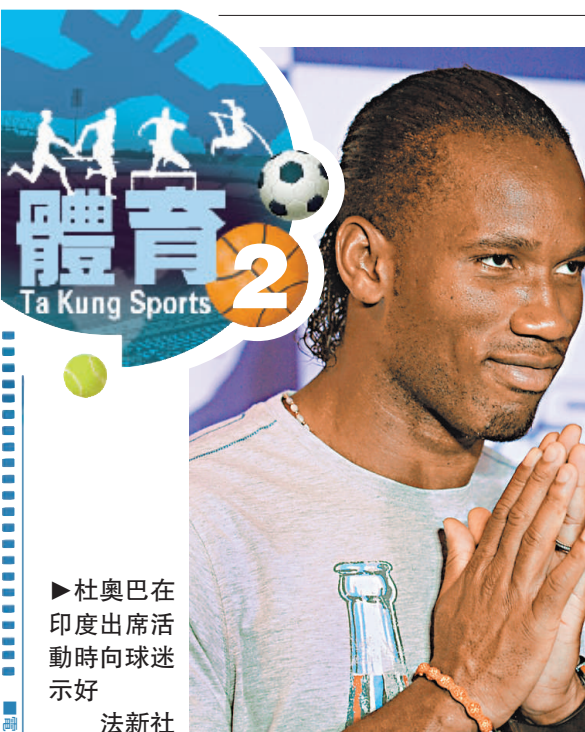
▶杜奧巴在印度出席活動時向球迷示好