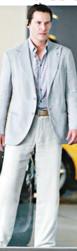
▲ 奇洛李維斯剃鬚兼穿上西裝出鏡