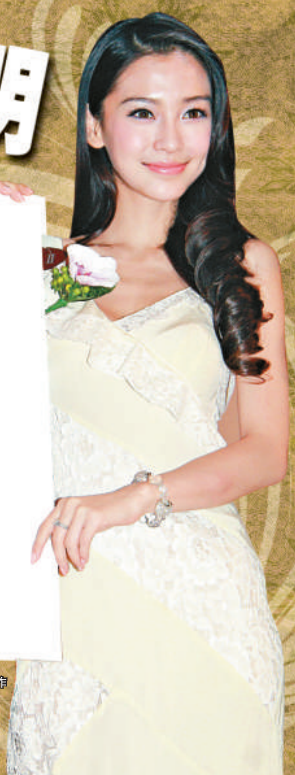
◀ Baby 讚黃曉明（小圖）皮膚好