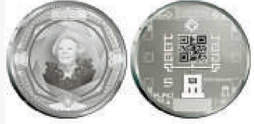
▲荷蘭推出的QR碼紀念幣

別小看這不起眼的圖樣，當中可是藏了不少有效信息呢，通過手機掃描，連接上網，可獲得文字，圖片，網址等信息，利用這些信息就可購物，取得優惠，有各種各樣的用途。