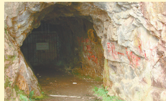
▲政府部門曾建議將已封閉的銀鑛洞重新開放

香港的自然資源不多，曾在歷史上留下記錄的資源有：香樹、鹽、珍珠、石材等。其實，還有一項鮮為人知的鑛物，就是「銀」。