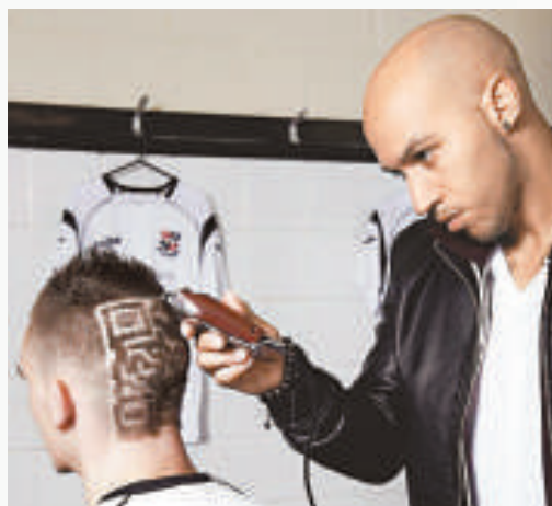
▲球員將頭髮剪成QR碼，十分搞怪

另外，荷蘭的鑄幣公司Royal Dutch Mint推出的100周年紀念幣上，也印有QR碼。據說這是世界上第一款有QR碼的硬幣，這款限量版硬幣分為兩種，分別為面值5歐元的銀幣和面值