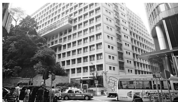
中區政府合署西座引發保育爭議