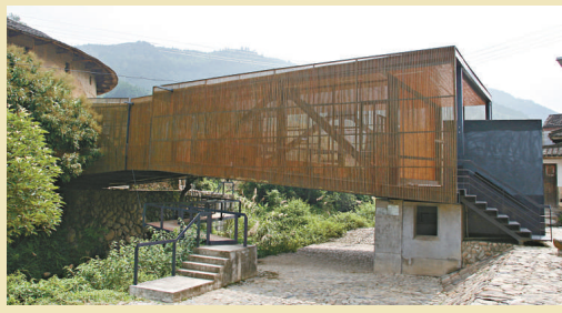
▲「橋上書屋」連接兩座土樓