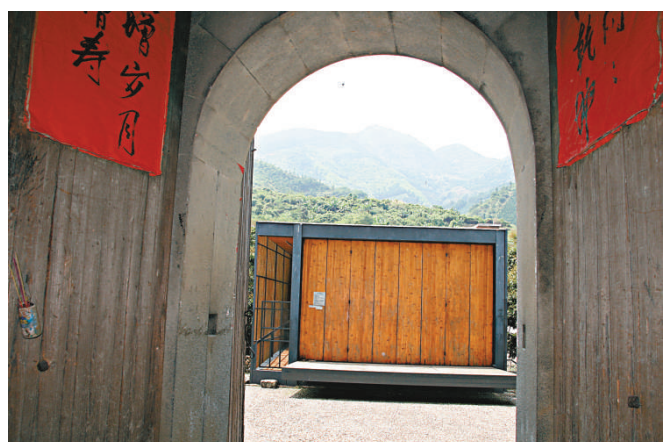
▲「到風樓」正對面就是「橋上書屋」