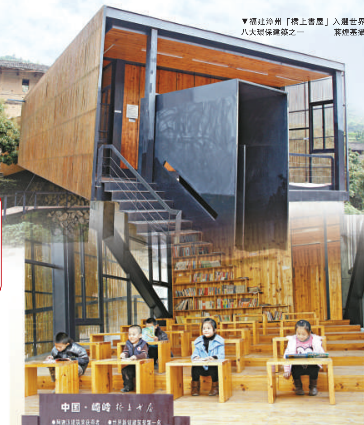
▼福建漳州「橋上書屋」入選世界八大環保建築之一

福建漳州「橋上書屋」近日被英國《衛報》評為世界八大最有創新性且具有可持續性的環保建築之一，為榜上的唯一中國建築。書屋的設計者李曉東稱，這座建築既環保，又融入當地風情，書屋與周邊環境、自然融為一體。