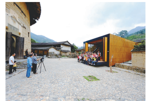
▲「橋上書屋」吸引全球多家媒體前往採訪