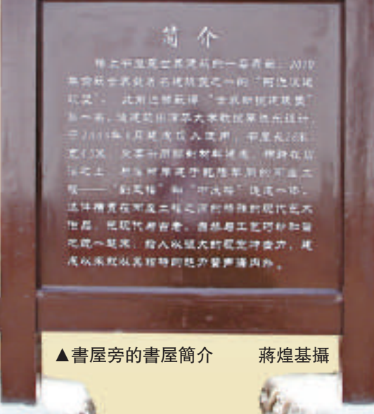
▲書屋旁的書屋簡介