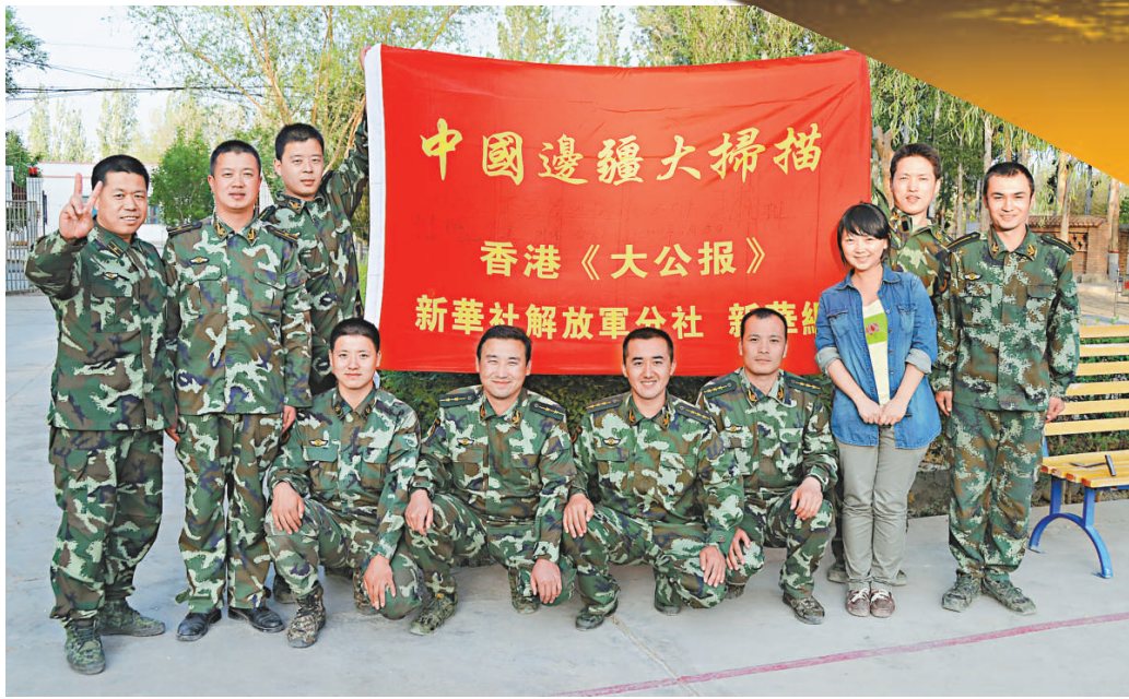
▲下馬崖邊防派出所官兵與「中國邊疆大掃描」旗幟合影