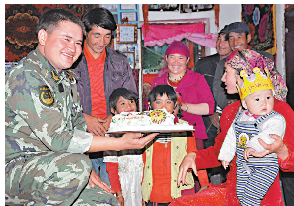
▲排依克邊防派出所官兵給轄區困難兒童過生日