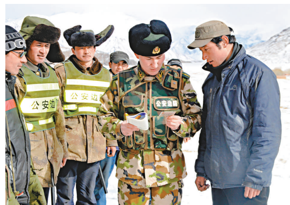
▲排依克邊防派出所官兵對流動人口進行檢查