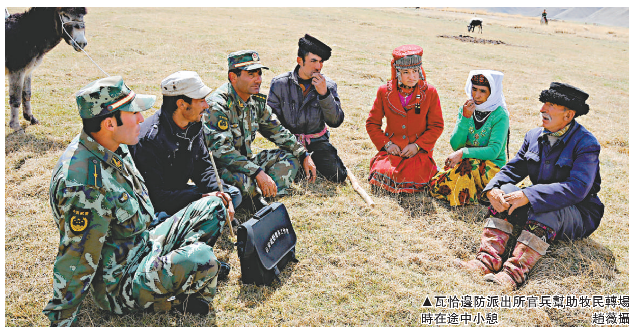
▲瓦哈邊防派出所官兵幫助牧民轉場時在途中休息