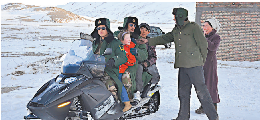
► 排依克邊防派出所官兵送學生上學