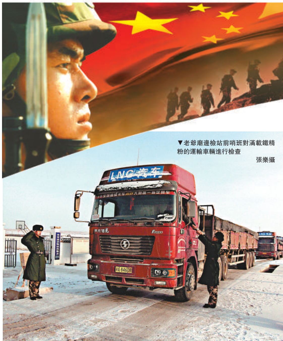
▼老爺廟邊檢站前哨班對滿載鐵粉粉運輸車輛進行檢查