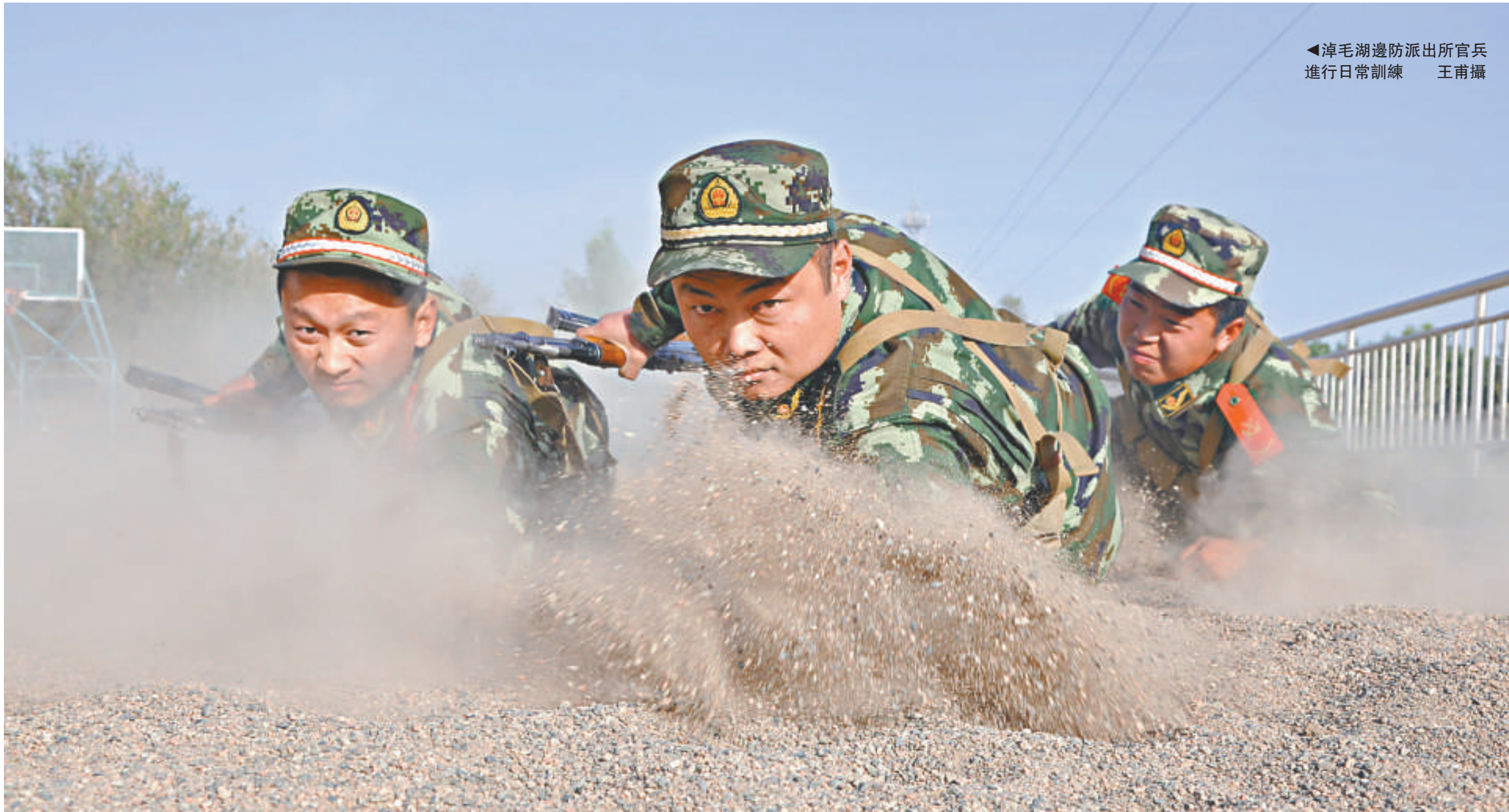
◀ 淖毛湖邊防派出所官兵進行日常訓練

中國對外開放口岸有441個，邊境管理區和海防工作區面積157萬平方公里，邊防轄區人口1756萬。中國公安邊防部隊是公安部直接領導下的一支公安現役部隊，是中國部署在沿邊沿海地區、出入口口岸和領海的一支重要武裝執法力量。編制10萬餘人。從武裝力量結構方面劃分，公安邊防部隊屬於中國武裝警察部隊的一部分，平行的兄弟部隊有內衛部隊、公安消防部隊、黃金部隊、森林部隊、交通部隊等。