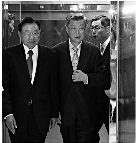
▲台「行政院長」陳冲（左2）與海基會董事長江丙坤（左1）25日在台北，出席大陸台商端午節座談聯誼活動晚宴

據了解，桃園縣議會參訪團於6月24日至28日在滬參訪交流。25日他們拜會了上海市人大常委會、寶山區政協等地，隨後還將參觀寶山區寶山寺、文道園等地。