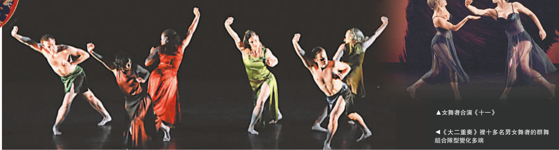
▶《大二重奏》裡十多名男女舞者的群舞組合隊型變化多端