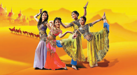
▲《東方·絲路》塑造了多幅瑰麗多彩的東方風情畫

伏羲是中華人文始祖，位居「三皇之首」、「百王之先」。伏羲一畫開天，肇啓文明，開創了中華文明之先河。數千年來，受到中華兒女世代崇敬。伏羲祭祀活動始於春秋，歷代延續，至明代已形成規模宏大、禮儀嚴謹的官方祭祀典禮。二〇〇六年公祭伏羲典禮被列入國家首批非物質文化遺產保護名錄。