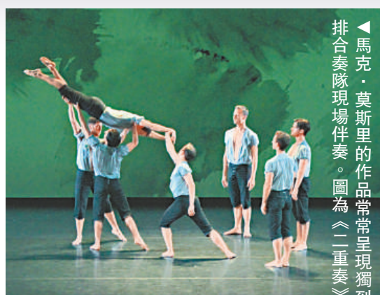
▶馬克·莫里斯的作品常常呈現獨到的多層次動律場景，並安排合奏隊現場伴奏。圖為《二重奏》