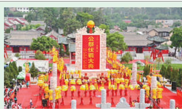
▲樂舞告祭場面盛大

【本報訊】記者柴小娜天水報導：甘肅省公祭中華人文始祖伏羲大典本月二十二日在天水伏羲廟舉行，莊嚴肅穆，古樂悠悠。來自新西蘭、澳洲、柬埔寨、法國等二十三個國家和地區的世界華人社團組織代表，港澳台代表，以及當地民眾共計萬餘人參加了公祭伏羲大典。