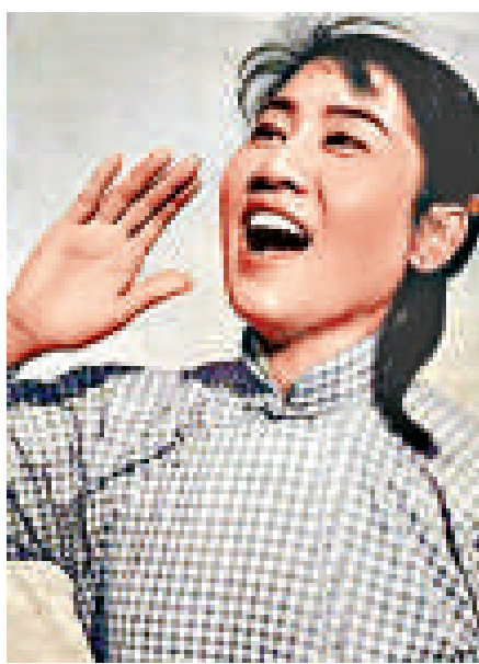
▲一九六二年張瑞芳主演《李雙雙》，翌年獲百花獎影后桂冠