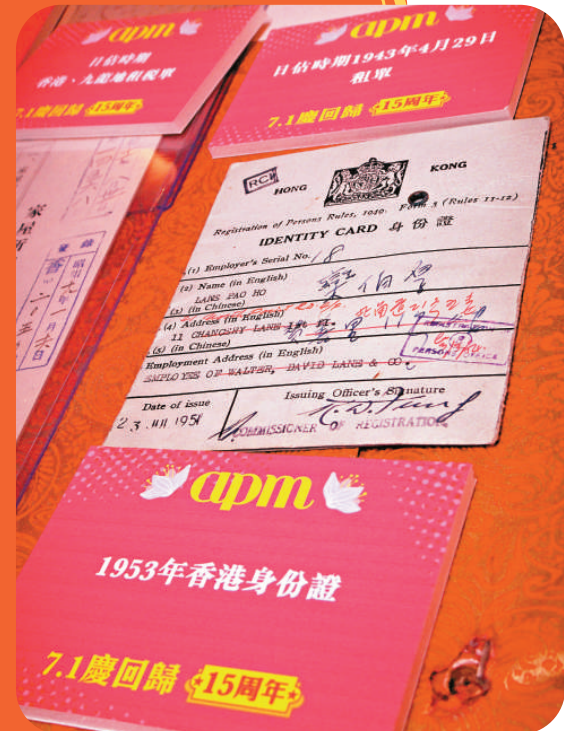
▲一九五三年英國殖民時期的香港身份證