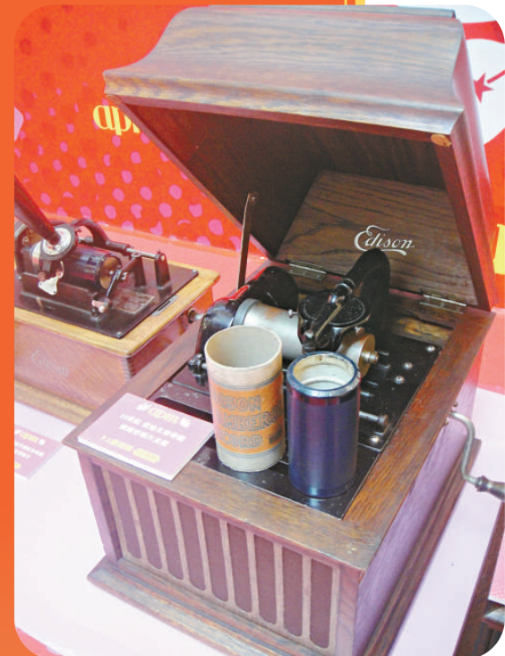
▲十九世紀愛迪生留聲機、筒形唱片及殼