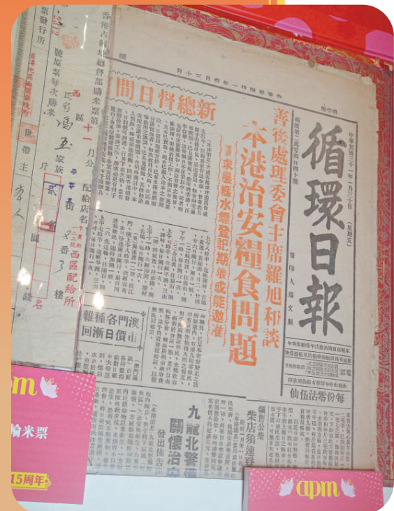
▲一九四二年一月三十日的《循環日報》