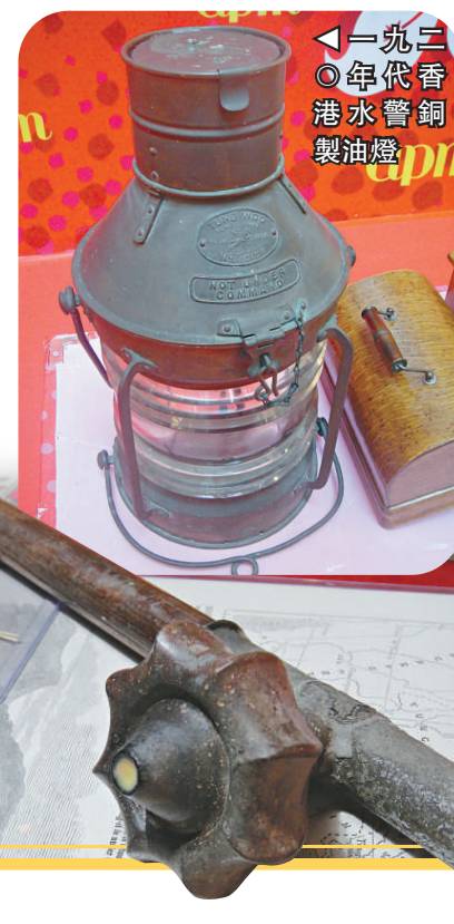
▲一九二〇年代香港水警製油燈

看完展覽，或許心情沉重，但也證明了這極具說服力與震撼力的收藏品，使市民銘記歷史，更加珍惜現在的生活。