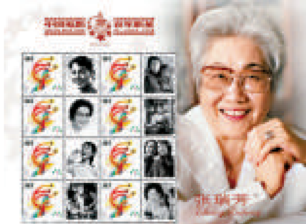
▲張瑞芳獲「國家有突出貢獻電影藝術家」稱號，圖為表揚她多年來藝術成就的紀念郵票