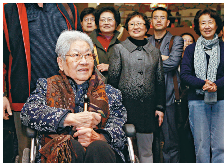
▲二〇一〇年十一月二十日，慶祝表演藝術家張瑞芳從影七十周年活動在滬舉行