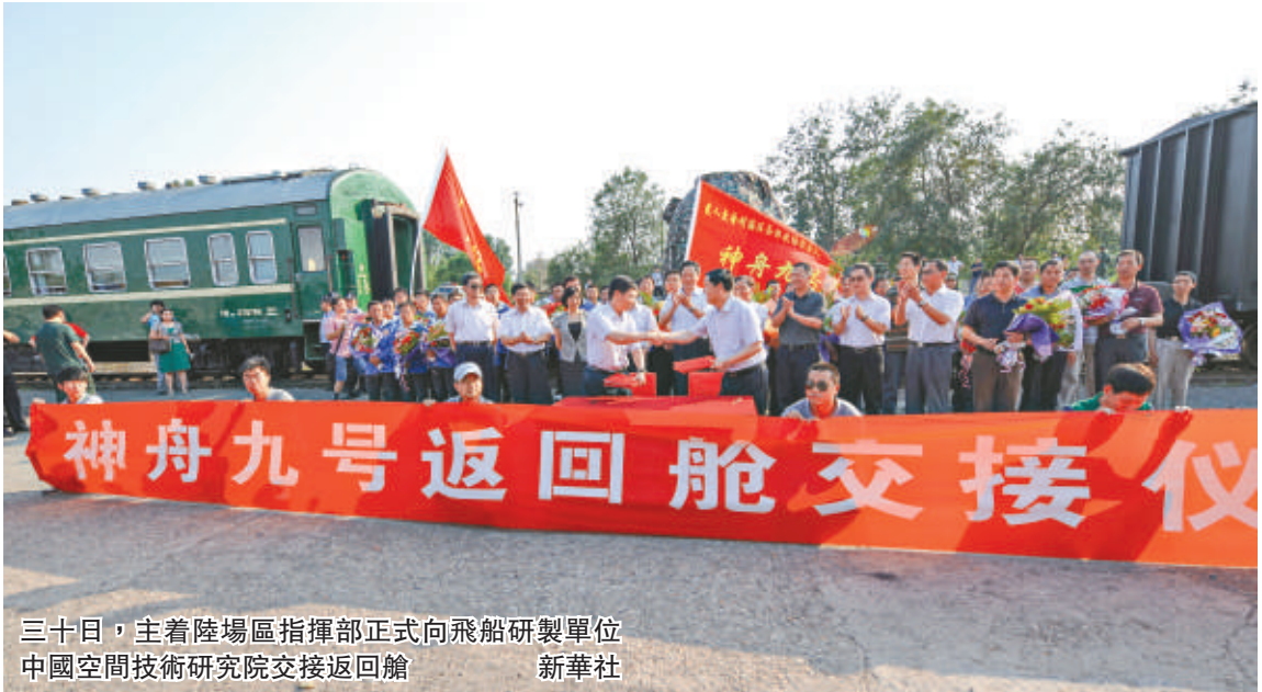
三十日，主着陸場區指揮部正式向飛船研製單位中國空間技術研究院交接返回艙

醫學隔離期約為14天，航天員將在航天員公寓內適應地球環境尤其是重力環境，提高心血管系統和支持運動器官功能，提高立位耐力，消除飛行後疲勞。除了醫學措施，航天員還會接受按摩、中藥調理等