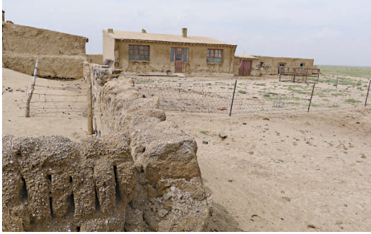
▲本報記者喬輝藏身的廢棄土房