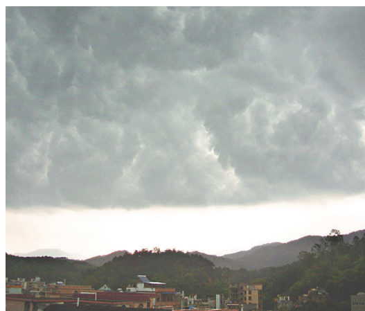
5月3日，廣東廣寧縣城籠罩在烏雲下，當日中午，整個縣城被傾盆大雨洗禮

本港天文台的暴雨警告信號由輕至重分為黃色、紅色、黑色三級。黃色信號代表廣泛地區錄得或預料會有每小時雨量超過30毫米的大雨，紅色是超過50毫米，黑色是超過70毫米。而我們的