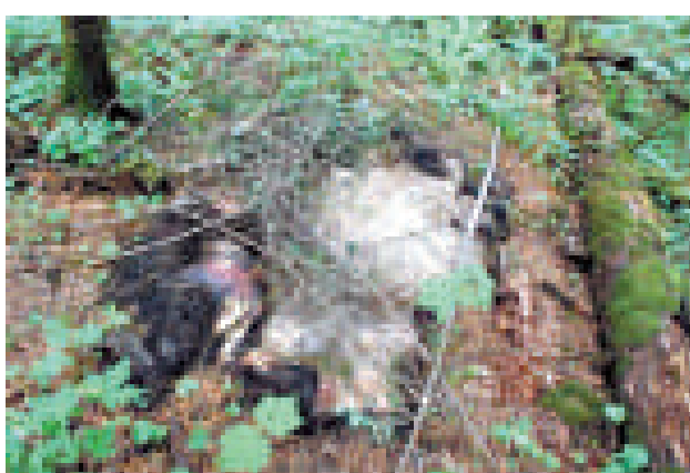
▲「屠熊案」現場可見遭毒手的黑熊遺骸

長白山自然保護管理中心主任李志宏表示，他們將認真汲取此次教訓，嚴格落實管護責任，加強野生動物市場監管，建立和完善聯合執法的長效機制，並調動社會力量參與野生動物保護工作。