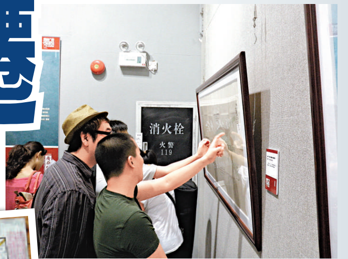
▲觀眾興致勃勃在老地圖上尋找記憶中熟悉的街道

記者在現場看到，《廣東省廣州市海南地圖》和《廣東省廣州市地圖》是稿本，因此兩幅地圖上都沒有關於測繪人、測繪時間等詳細信息，不過廣東省社科院研究員陳忠烈說，從圖上「興」、「關」等文字的寫法可以推測，地圖的繪製者是日本人。