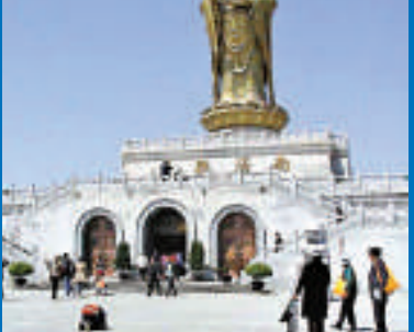
▼ 地藏菩薩道場——九華山