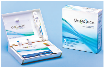
▲該自檢器是利用採取唾液中的抗體來檢驗是否感染愛滋病病毒 BBC網站

【本報訊】據英國廣播公司4日消息：世界上第一個無需處方、可自行在藥房購買的愛滋病自行檢驗器獲准在美國銷售。這款自檢器是利用採取唾液中的抗體來檢驗是否感染愛滋病病毒，並且在20至40分鐘內可以知道結果。 美國政府估計，美國有120萬人的愛滋病病毒檢驗呈陽性，但其中兩成的人並不知道本身已感染愛滋病病毒。 美國食品和藥物管理局表示，希望經由使用這種自檢器可以改變不知本身已被感染者的行為，從而減少愛滋病的擴散。這種愛滋病自行檢驗器預計將在全美30000多家藥房和網上銷售。 愛滋病自行檢驗器的生產商 OraSure 並未說明該產品的售價，但證實不會超過60美元。該公司負責人說，預計各主要零售銷售渠道都將出售這款產品。 防治愛滋病團體對當局批准愛滋病自行檢驗器的銷售表示支持。不過，美國食品和藥物管理局強調，這個檢驗並非百分之百準確，有必要請醫療專家證實有關的檢驗結果。