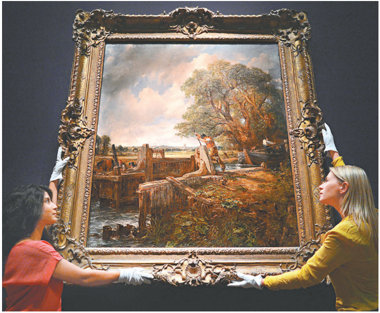
▲名畫《船閘》或被私人收藏，公眾難再欣賞