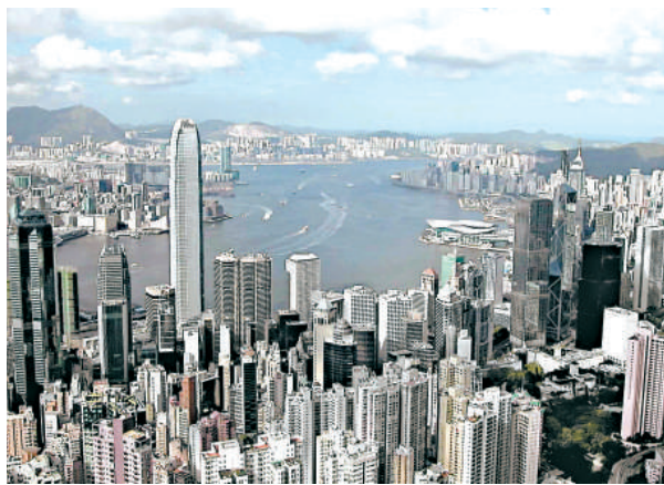
▲香港的居住環境優劣一直是大眾關注焦點

除了大阪原居民外，日本人都寧願住在魅力無窮的大都會東京，而不是工業省城大阪，尤其後者正在經歷經濟困難時期。此外，經情社的排名，原本是為人力資源部經理們設計的，旨在根據僑民在外國生活的舒適度來調整工資。東京有很多會講英語的人，且有中文標誌；大阪則很封閉，什麼都是日語。 值得注意的是，這一排名並不包括大眾心目中很多美麗的城市，這是因為它們都被比賽獲獎者洛瓦托在其樣本中設定的人口限額排除在外了。