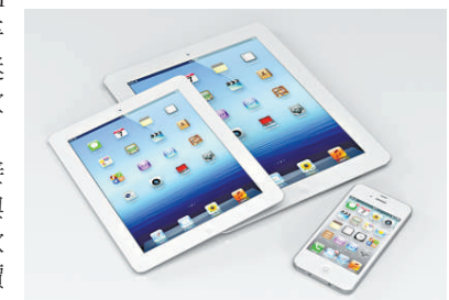
▲蘋果有望在10月推出平價迷你iPad 互聯網

【本報訊】據彭博社4日消息：有知情人士透露，蘋果面對谷歌與微軟積極搶進平板電腦市場，計劃在年底前推出低價迷你iPad，以此保住自己的老大地位。 據悉，蘋果迷你iPad將配備7至8吋螢幕，相較過去幾代的iPad都是9.7吋。知情人士表示，蘋果有望在10月發表迷你iPad，迷你iPad將不會如3月問世的新iPad一樣，採用高解析屏幕。 Sterne Agee & Leach Inc. 分析師 Shaw Wu 表示，平板電腦市場快速成長，若蘋果迷你iPad大打低價牌，將粉碎谷歌、微軟與亞馬遜的爭奪野心。 蘋果迷你iPad的售價可能接近谷歌的 Nexus 7 平板電腦與亞馬遜的 Kindle Fire。後兩款平板均採7吋屏幕，每台售價199美元。 蘋果發言人穆勒謝絕對此傳言置評。