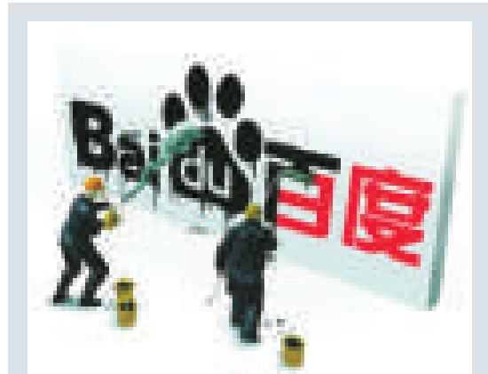
▲2010年1月13日，百度被黑客篡改了域名，因此「癱瘓」一上午，使得國內近半網民上網受到影響

學、音樂、影視、遊戲、動漫、軟件等重點領域以及圖書、音像製品、電子出版物、網絡出版物等重點產品，加強監管力度，以查破辦結一批大案要案為目標，有力維護網絡環境下健康、規範的版權秩序，有效遏制網絡環境下侵權盜版違法行為的高發勢頭，建立網絡環境下版權保護長效工作机制，進一步促進網絡產業繁榮發展。