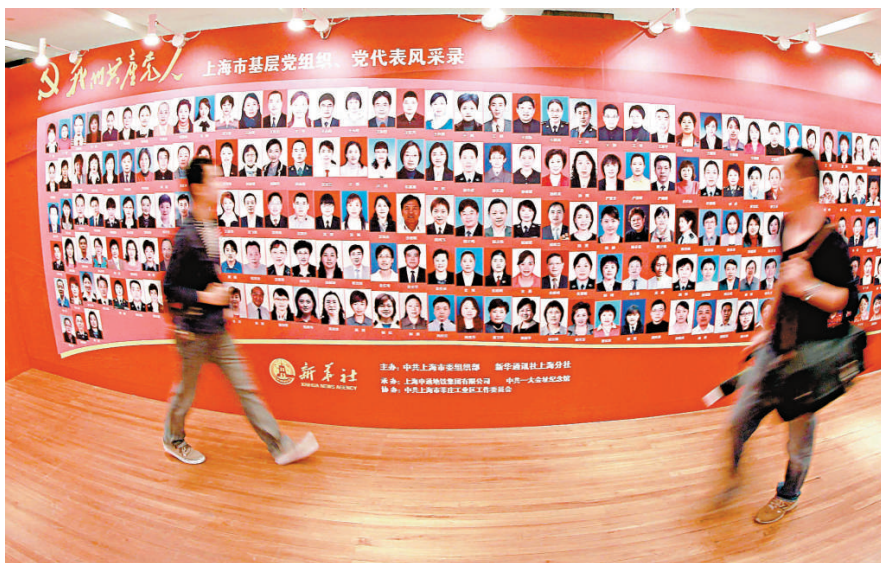
▲上海月前舉辦「我們共產黨人——上海市基層黨組織、黨代表風采錄」圖片展，兩位參觀者走過黨代表「風采錄」

十八大代表的選舉工作直接關係到大會的順利召開，將負責選舉新一屆中央委員會。中共中央去年11月印發了《關於黨的十八大代表選舉工作的通知》，對選舉作出全面部署。在選舉過程中，大多數代表團對候選人預備人選面向社會進行了公示，選舉過程中實行了差額選舉並將差額比例提高到15%，保證了選舉的民主性、公開性。