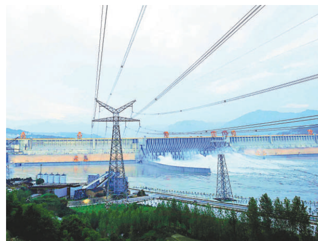
▲4日，三峽水電站全部機組投產，發電效益全面發揮

中方改善中梵關係的原則和立場是明確的、一貫的，態度是積極的、開放的。我們願意與梵廷就包括主教祝聖問題在內的任何問題進行磋商，但在雙方達成一致前我們將一如既往地支持中國天主教會開展自選自聖主教工作，這是毋庸置疑的，也是無可指責的。我們敦促梵廷撤銷所謂「絕罰」威脅，回到對話的正軌立場上來。