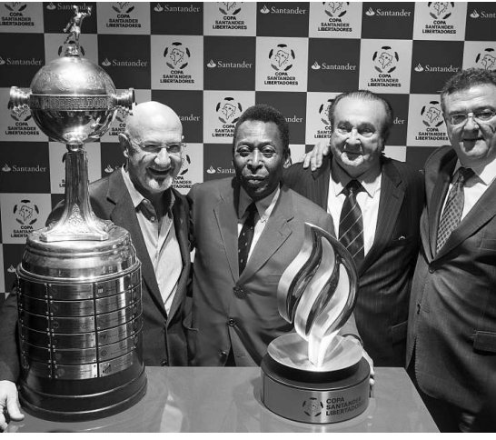
▲球王比利(左二)出席自由杯賽前記者會

曾經被嘲笑為「烏鴉嘴」，屢屢預測球賽不命中的比利這次挽回聲望，他在歐洲杯預測西班牙能贏意大利2：0，雖然比中不中，但起碼猜對了勝方。