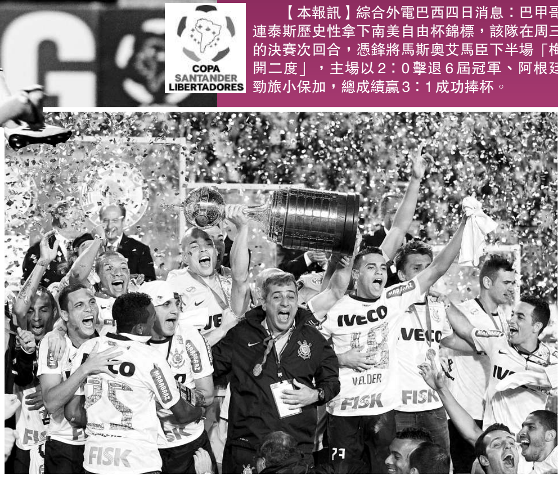
▲哥連泰斯歷來首捧自由杯