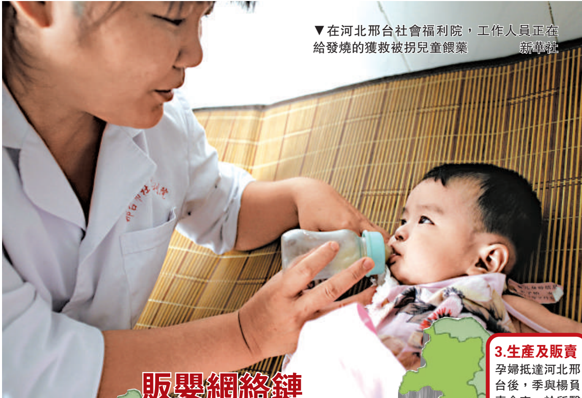
▼在河北邢台社會福利院，工作人員正在給發燒的獲救被拐兒童餵藥

另據《新京報》報道，被解救的孩子已分別被送往福利院，並抽取血樣檢測DNA信息以尋找親生父母。根據法律規定，如果尋找親生父母未果，這些被拐賣的孩子將由福利院照顧。