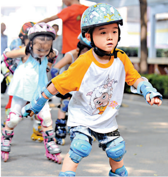
◀暑期來臨，山西太原市許多家長帶着孩子來到少年宮學習輪滑，體驗「飛翔」的快樂。圖為小朋友在學習輪滑

這位負責人表示，比起探親、旅遊以及媒體的報道，「尋根之旅」能讓海外青少年更全面的了解中國。來自愛爾蘭的大學教師劉曉玲表示，自己已經是第三次參與這一活動，而帶領的營員人數已從最初的5人發展到今年的18人。她告訴記者，學中文在愛爾蘭已成熱潮。當地甚至流傳這一說法，現在會中文是優點，將來不會中文就是缺點。她說，青少年學習中文最大的難點不是說是寫，僅在課堂上灌輸效果不理想。反倒是把孩子們組織到一起邊玩邊學更好，這也是「尋根之旅」在國外受歡迎的原因。