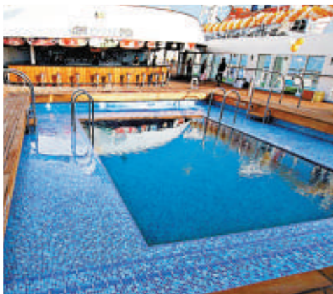
◀▲「中華之星」內部裝修豪華，圖為其內部的餐廳及游泳池