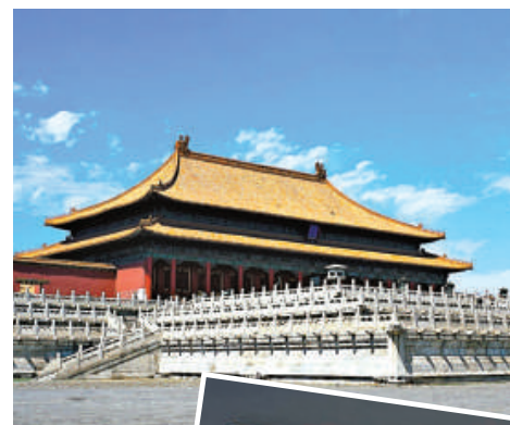
▲故宮藏品——乾隆畫珐琅雙蝠圓柱形燈檯