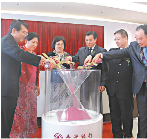
▲台灣銀行上海分行10日舉行開業儀式 中新社

據了解，目前在上海已開設分行的銀行包括第一銀行、國泰世華銀行、土地銀行、中國信託商業銀行，此外國泰世華銀行第2家大陸分行開在青島，以及蘇州的合作金庫、彰化銀行、南京的永豐銀行、東莞的玉山銀行等。將在下月舉行的第8次陳江會預計將討論關於兩岸貨幣清算的問題，若能達成共識，最快9月兩岸銀行相互開放貨幣清算便可初露眉目。