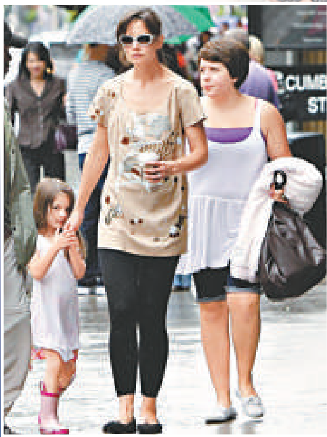
▲湯告魯斯的養女伊莎貝拉（右）在數月前被姬蒂炒魷魚