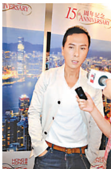
▲正在紐約出席亞洲電影節的香港武打明星甄子丹，獲頒今年的「亞洲之星」獎

為表彰甄子丹對電影業的貢獻，本屆亞洲電影節特頒其「亞洲之星」獎。對於是否考慮向荷里活發展，甄子丹告訴記者，拍一部電影，從籌備到拍攝再到從角色中脫身回到現實中的自己，每個環節都需要好幾個月時間，他暫時還沒有看到值得自己投入這麼長時間的荷里活劇本，而且他目前的檔期已經很滿，因此目前還沒有向荷里活發展的計劃。