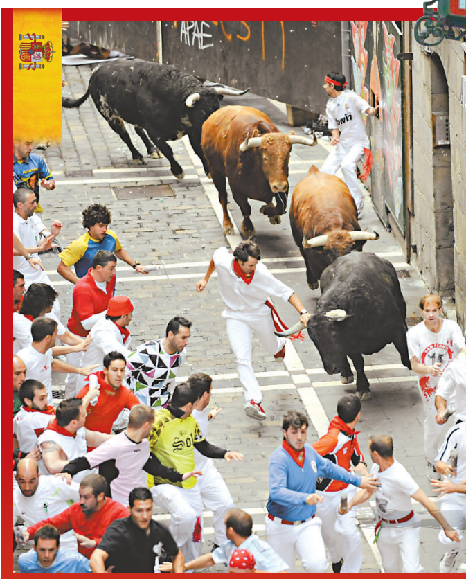
▲西班牙奔牛節激烈追逐的現場