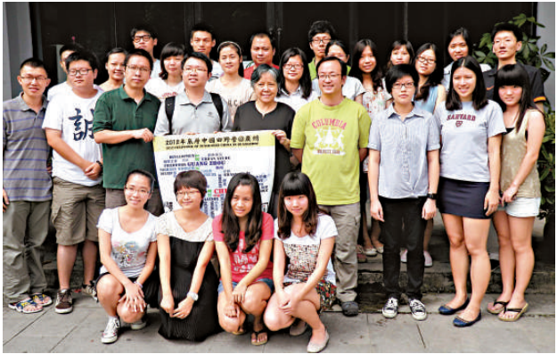
▲「2012 年底層中國田野營」開營 本報攝

總體看來，目前不少校長的致辭，沒有走網絡套話的路線，但畢業典禮致辭，基本上是一個模式，談四年前入校的寄語，四年中的成敗得失，再給學生一點進入職場的建議。大多數類似通常的處世哲學，我覺得一個好的畢業演講，是沒有固定模式的，校長大膽發揮風格就好。