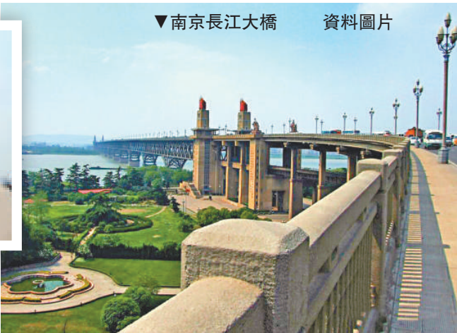
▼南京長江大橋 資料圖片