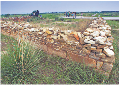
▲中國第 42 處世界遺產——內蒙古錫林郭勒草原深處的元上都對外開放 中新社

中山大學社會學與人類學學院教授朱健剛認為，底層人士通常不善於表達意見，容易引發情緒甚至暴力，讓大學生作為一個中介與社會溝通，對社會和諧有好處。