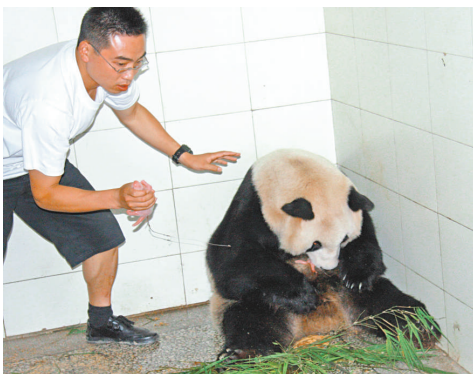
▲工作人員將「喜妹」老二取出，老大則一直在「喜妹」懷中

史書記載，元朝歷代皇帝為避暑熱，每年率文武百官、嬪妃侍從到上都避暑遊獵和處理政務，並與漠北蒙古貴族聚會於此。