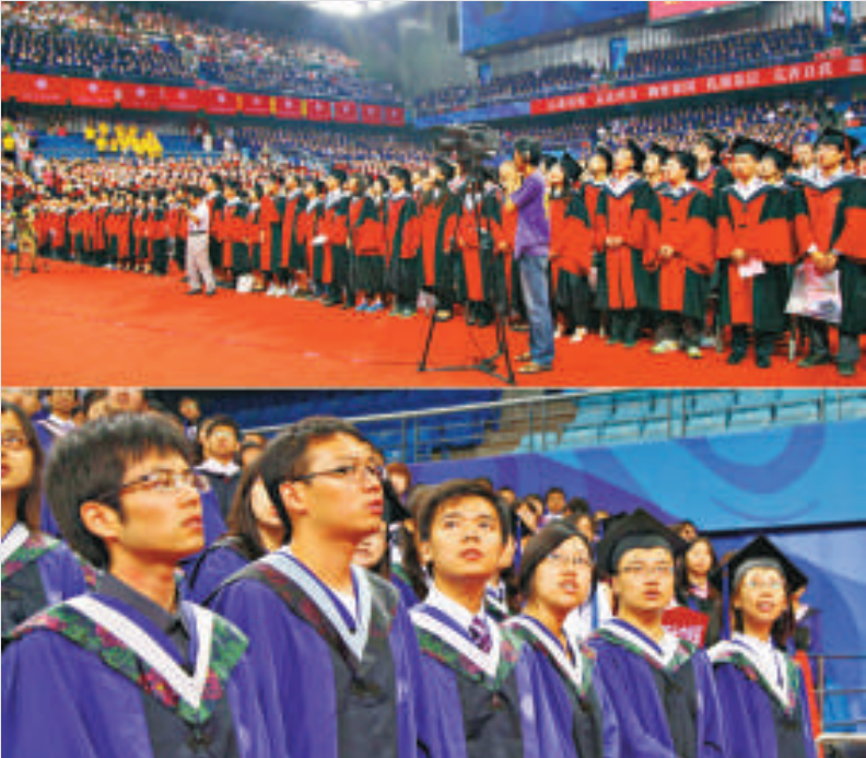
▲北京大學畢業典禮最後，全體師生起立，齊唱《歌唱祖國》

最後，他還叮囑學生「千萬別在精明的方向走得太遠，切莫以為別人都是傻子；別在抱怨的方向走得太遠，多想想如何建設；別在仇恨的方向走得太遠，人不能生活在仇恨之中；別在功利和俗氣的方向走得太遠……要記住為什麼而出發，也要知道在去遠方的路上，也不必走得太快」。