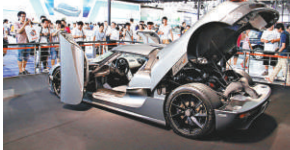
▲豪華吸引眾多市民駐足