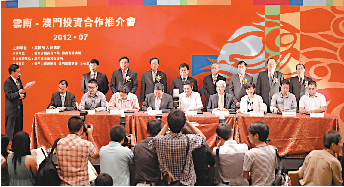
▲「雲南—澳門投資合作推介會」十二日在澳門舉行。圖為簽約儀式

李紀恆並就深化滇澳合作提出了四點建議，第一，進一步加強旅遊合作，雲南和澳門同屬最具吸引力的旅遊目的地之一，旅遊業基礎較好、特色鮮明。雙方可在打造旅遊品牌、建立旅遊信息共享平台、精品旅遊線路推廣、旅遊產品開發等方面聯手合作，互利共贏。