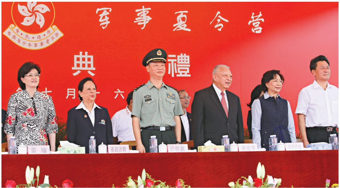
▲出席青少年軍事夏令營開營禮的嘉賓：（左起）外交部駐港副特派員姜瑜，青少年軍事夏令營發起人董趙洪鴻，駐港部隊政委岳世鑫，全國政協副主席董建華，特首夫人梁唐青儀，中聯辦副主任李剛

夏令營發起人董趙洪鴻表示，軍營教育是全人教育，是愛的教育，她寄語「小兵」們在軍營中把握難得的機會，學習服從紀律、團結友愛、樂於助人的精神，成為知識豐富、全面發展和愛國愛港的人才。她