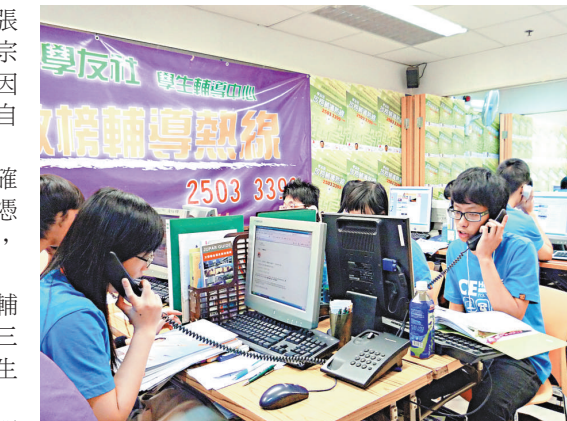
▲學友社指出，由去年九月至今，累積收到約四百宗中學文憑試考生求助個案

小巴學生乘車優惠」、「延長康文署轄下設施的學生優惠時段」、「減低教科書的價格」，以此減輕通脹對學生帶來的負擔。 「少年財政司」計劃旨在培育兒童及青少年建立正確理財觀念，學會管理風險，制訂人生計劃。今次一共有34間中學參加，共提名了68位中二至中三學生，經面試後，一共有23名學生獲選為第三屆「少年