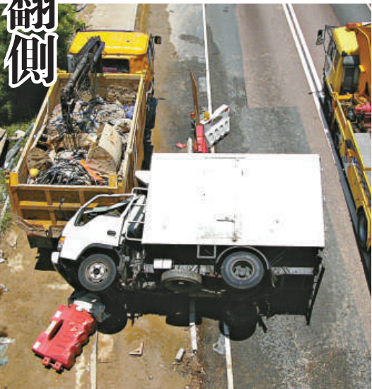
▲貨車昨日在粉嶺公路失事，掃毀路邊工程地盤水馬後翻側，再撞及停泊附近的泥斗車