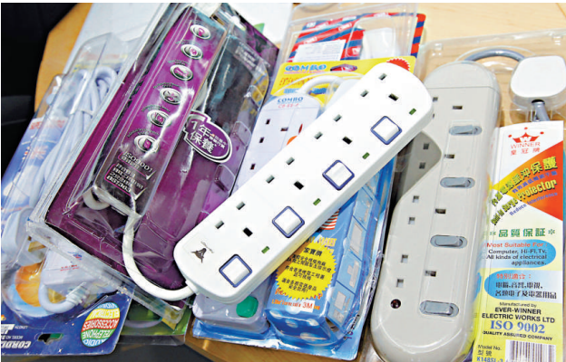
▲消委會聯同機電工程署測試市面十六款拖板，僅五款通過全部測試

前晚十時許，因臭味愈濃中人欲嘔，有街坊感到可疑報警。警員到場拍門無人回應，由消防員協助破門，赫見有兩隻狗倒斃屋內，一隻陳屍客廳身體乾瘦，另一隻在廚房，屍身腐爛長滿蛆蟲；另外又在房間找到兩隻骨瘦如柴、身體虛弱唐狗。警員初步調查，不排除四隻唐狗因主人失蹤多日沒進食，最終餓死餓壞；愛護動物協會其後把狗屍和劫後餘生兩狗帶走。