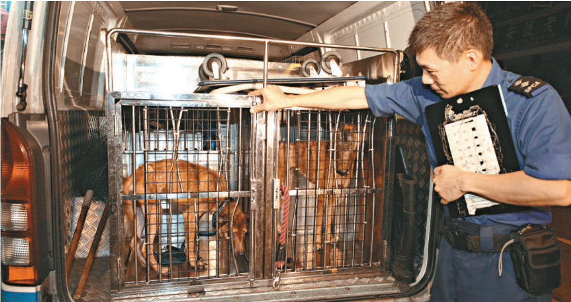
▲兩隻劫後餘生唐狗，由愛護動物協會領走暫時照顧

【本報訊】土瓜灣美景街四隻唐狗因主人離家失蹤，斷糧缺水逾月住所變地獄，結果兩隻活生生餓死、另兩隻「瘦剩排骨」，前晚十時許，因狗屍傳出惡臭街坊報案，警員到場始揭發；兩隻劫後餘生唐狗，由愛護動物協會領走暫時照顧。