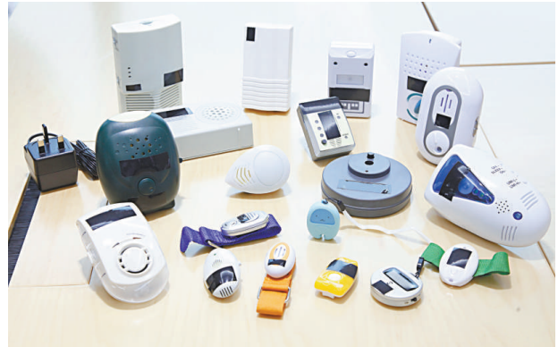
▲消委會研究顯示，市面一些利用生成聲波、超聲波或電磁波驅蚊或驅蟲的儀器，沒有科學證據支持

機電署表示，已詳細分析報告並跟進，樣本在正常使用下不會構成危險，署方已敦促有關供應商改善產品質量，部分供應商已即時停售。實惠家居回應指，該款拖板已售出一萬四千件，至今未收到投訴或意外，相信消委會測試屬個別事件。