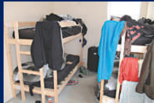
▲一個房間要同時住10個人 英國《每日郵報》 ▼大部分清潔工人來自歐洲其他國家 英國《每日郵報》

倫敦奧組委一名發言人說：「SIS公司向我們保證，他們向其員工提供的住宿符合相關標準。」