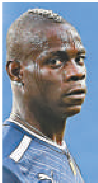
▲「巴神」兩歲時被親生父母交給別人領養 英國《每日郵報》