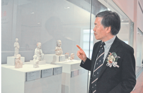
▲林業強說，潮州瓷器在借鑒景德鎮和德化窯的同時，也糅合潮州本地文化特色

此次展覽由香港中文大學博物館、廣東省博物館、潮州市博物館和潮州市頤陶軒陶瓷文化研究所合辦。饒宗頤教授亦予頗多支持，並親題「南國瓷珍」四字為展覽名。展期至十二月二日。查詢可電三九四三二四一六。