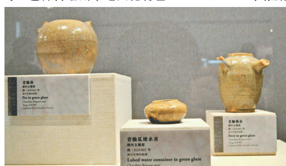
▲唐代的潮州窯，生產器物多以日用品為主