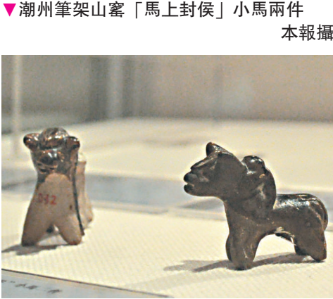
▶潮州筆架山窯「馬上封侯」小馬兩件