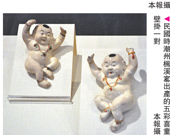
▲民國時潮州溪窰出產的五彩喜童壁掛一對