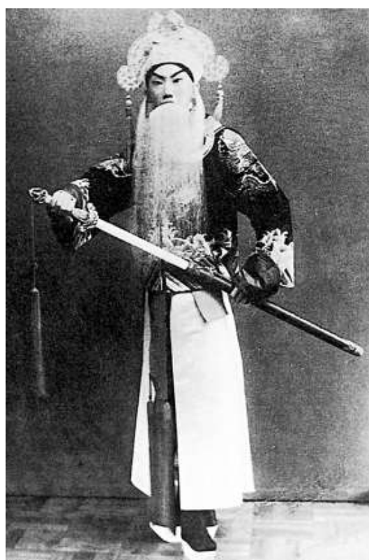
▲楊寶森主演老生唱功戲《文昭關》，亦是其首本名劇之一