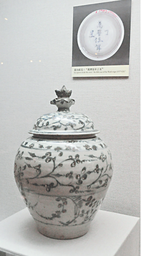
◀青花纏枝花卉紋蓋罐產自明代潮州窯