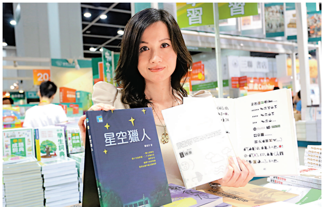
▲有出版商推出「無字天書」，內容全為簡單圖案，啟發讀者創意

【本報訊】多種不同類型書籍今攻佔書展。有出版社趁着回歸十五周年，推出《香港基本法起草過程概覽》，將《基本法》草擬過程每一字一詞首次曝光；亦有出版社推出全本以簡單符號「撰寫」成的《地書：從點到點》，啟發讀者的創意思考。