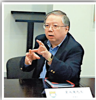
▲韋永康建議考生成績最佳的五科總分最好達到二十分