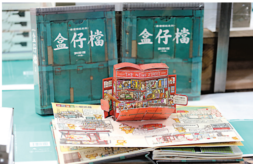
◀有出版商再度推出立體書，介紹本港各區特色攤檔

今年書展亦有出版社推出少女模特兒寫真。貿易發展局副總裁周啓良表示，今年收到一百五十六個簽名會申請，其中一名申請人為少女模特兒，他強調，少女模特兒入場為新書造勢時，造成混亂，阻礙讀者參觀或阻礙參展商工作，大會將採取相應行動，勸有關人士離開會場。他又說，今年大會與十三間旅行社合作，六十個來自內地、台灣及越南的旅行團入場參觀。