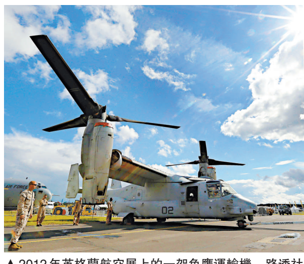
▲2012年英格蘭航空展上的一架魚鷹運輸機

【本報訊】據日本新聞網17日報道：美國國防部副部長卡特將從美國時間17日開始訪問日本，就美國在日本部署魚鷹運輸機的戰略意義和魚鷹運輸機的安全性等問題，向日本政府做出說明。卡特抵達東京後，將與日本防衛大臣森本敏等相關閣僚舉行會談，除了解釋美軍在山口縣岩國基地、沖繩普天間基地部署魚鷹運輸機的安全意義，提供一份有關魚鷹運輸機的安全性文件之外，還將就駐沖繩海軍陸戰隊搬遷關島，以及日美防衛協力等問題交換意見。