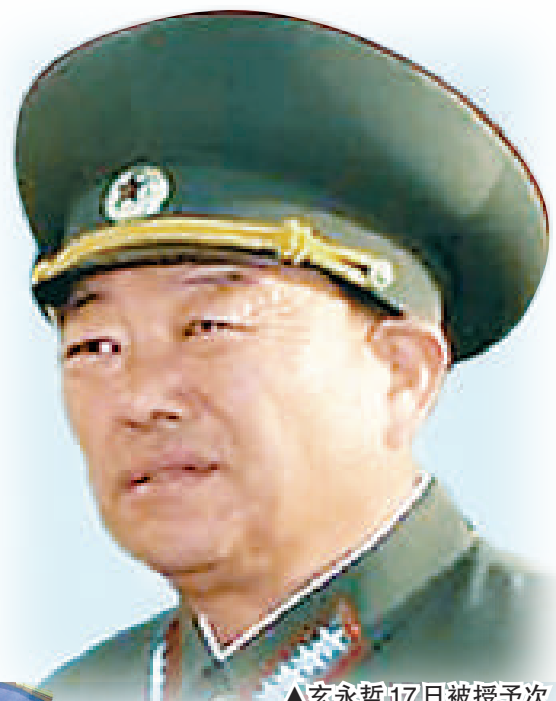
▲玄永哲17日被授予次帥的稱號