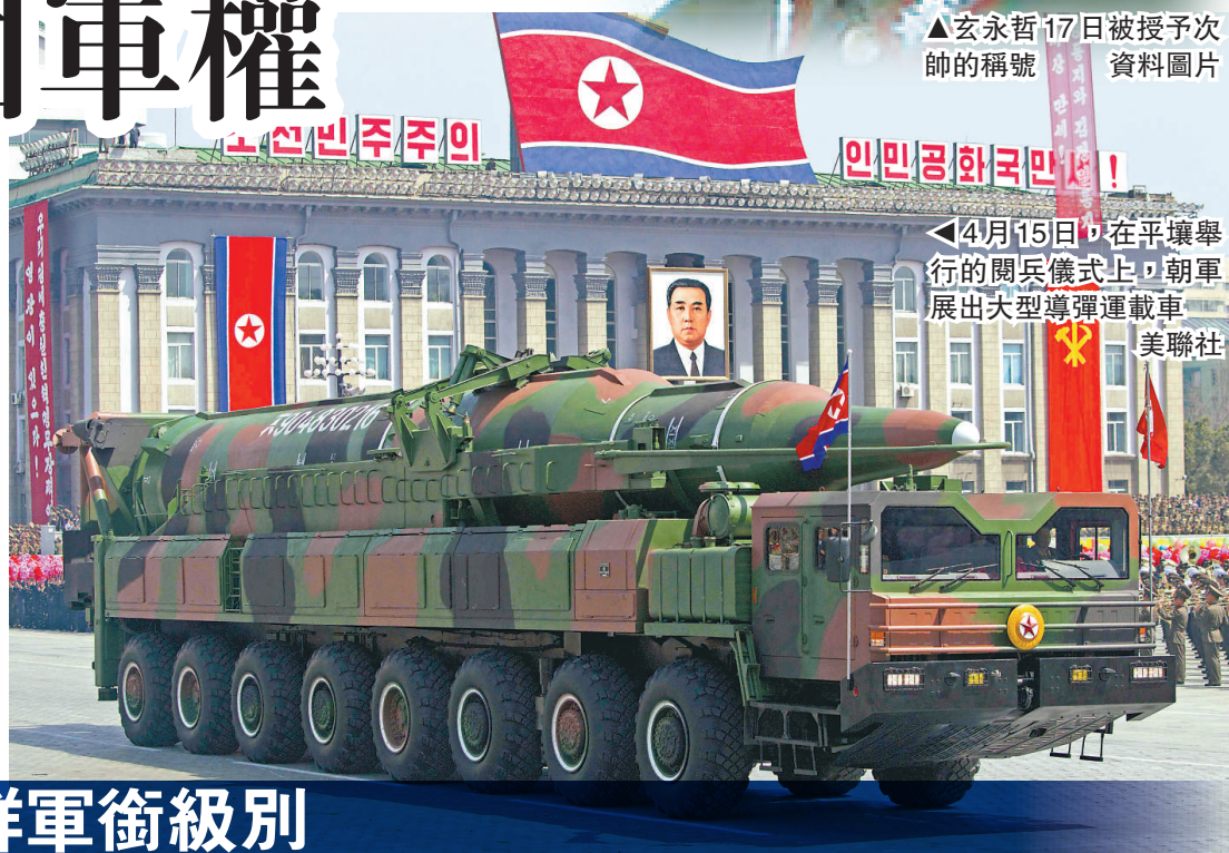
▲4月15日，在平壤舉行的閱兵儀式上，朝軍展出大型導彈運載車