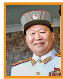
崔龍海 總政治局長