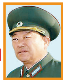
玄永哲 (料取代李英浩成為軍委副主席)