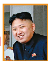
金正恩 朝鮮最高領導人