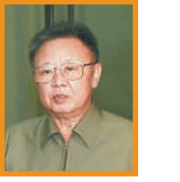
金正日 已故領導人