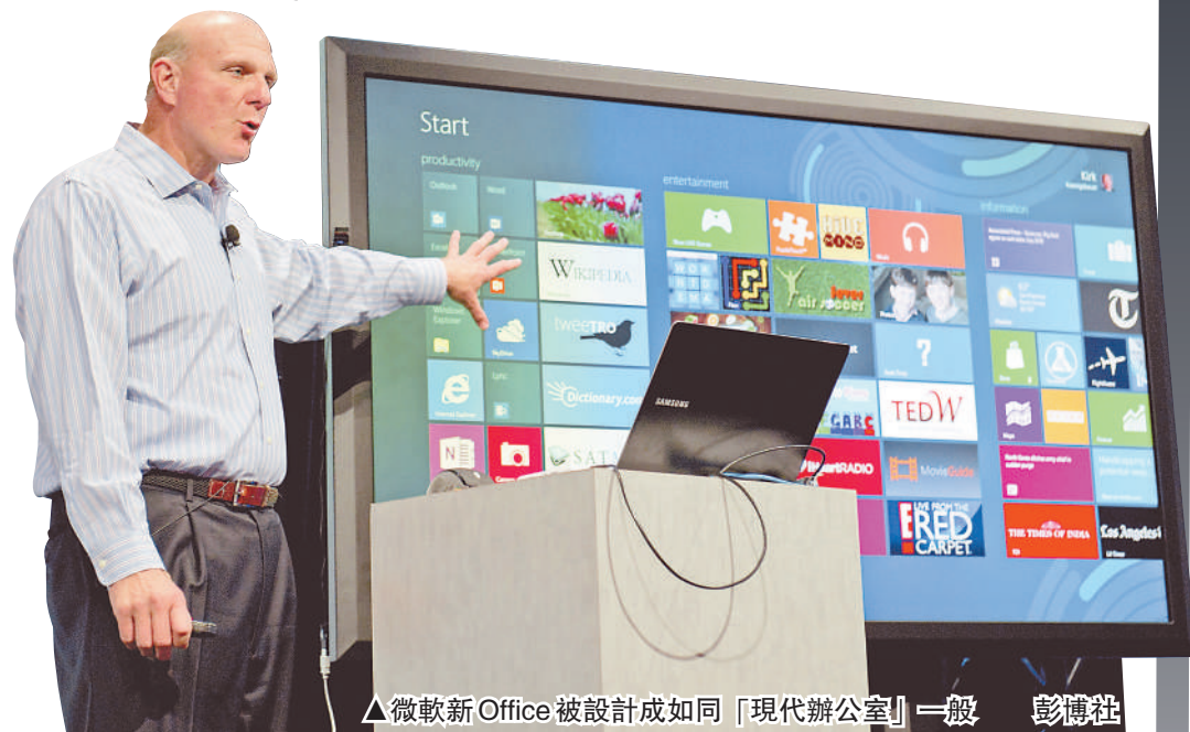
▲微軟新Office被設計成如同「現代辦公室」一般

和Win8一樣，新版Office被設計成能暢順、直觀地與在平板電腦及智能手機大受歡迎的輕觸式控制配合。微軟近期收購的Skype和企業社交網站Yammer，也已經融入Office中，支持視頻通話及社交服務，增強了協調工作和視頻會議功能，令人們更容易進行溝通和合作。