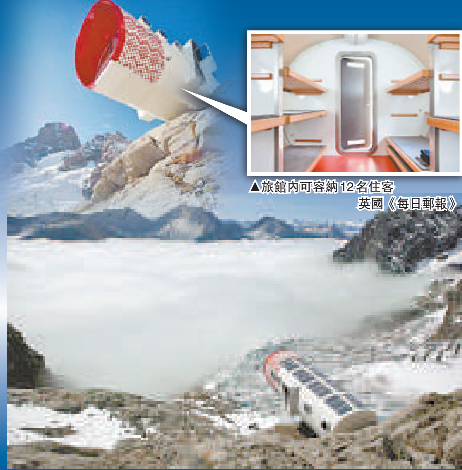
▲旅館內可容納12名住客