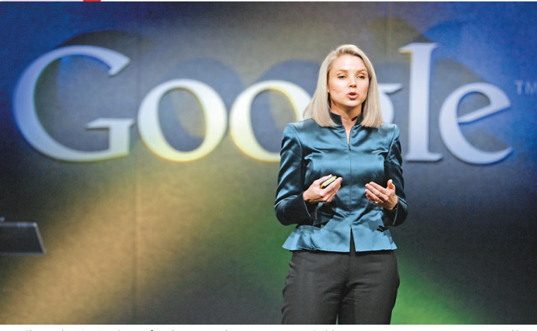
▲邁耶在谷歌時負責地圖和地理位置服務等項目