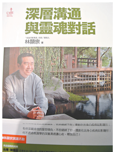
▲林顯宗《深層溝通與靈魂對話》（大塊文化）