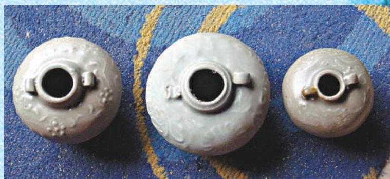
▲浙江龍泉窰的元代青釉雙繫罐