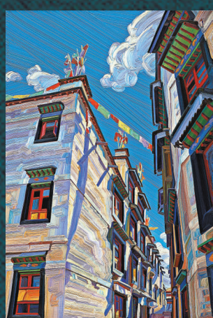
▶林鳶作品 《Barkhor Street No.3》

中國微型油畫家林鳶的油畫展——「西藏之光」，正於中環 Zee Stone Gallery 舉行，展期至本月三十一日。