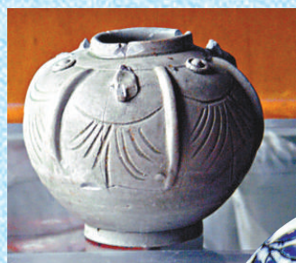
▲青釉瓜 棱罐，年代未 考