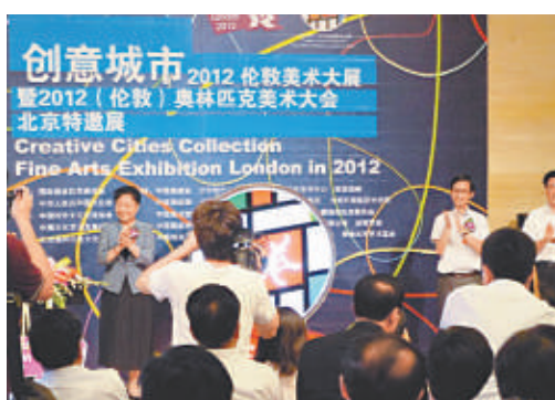
▲文化部副部長趙少華（左）出席畫展活動