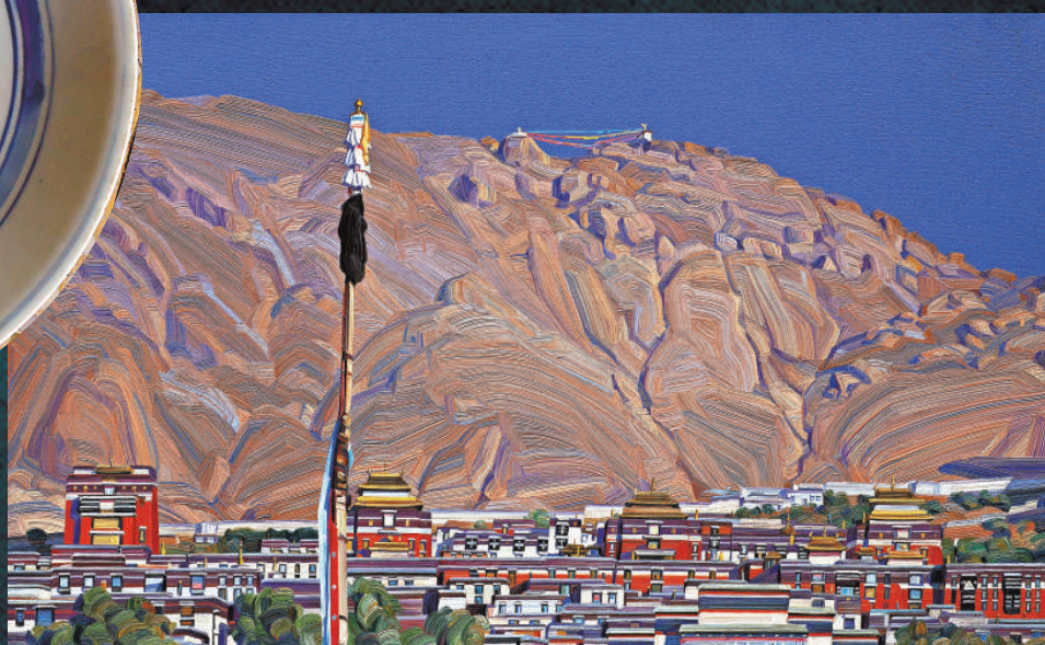
▲林鳶作品《Tashilunpo Monastery Full View》