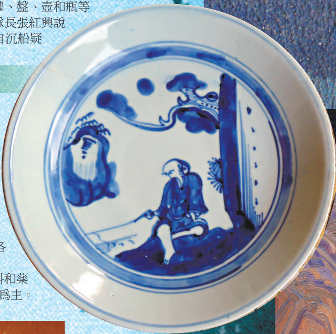
▲產自德化窰的清 代青花盤