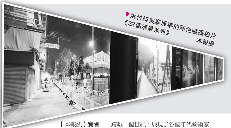
洪竹筠與廖雁寧的彩色噴墨相片《22個清晨系列》