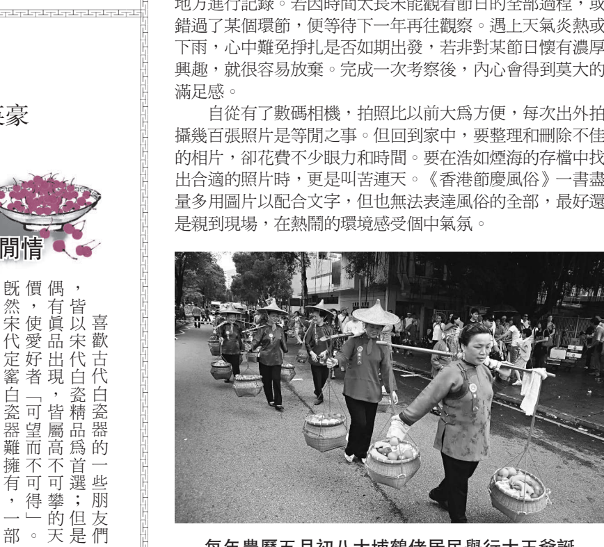
每年農曆五月初八大埔鶴佬居民舉行大王爺誕

與你同遊 喜歡古代白瓷的一些朋友們，皆以宋代白瓷精品為首選；但是，偶有真品出現，皆屬高不可攀的天價，使愛好者「可望而不可得」。既然宋代定窯白瓷器難得有，一部分人士則轉而覓藏元代白瓷、明代初期永樂至宣德時之甜白釉瓷和福建德化窯特製的白瓷。