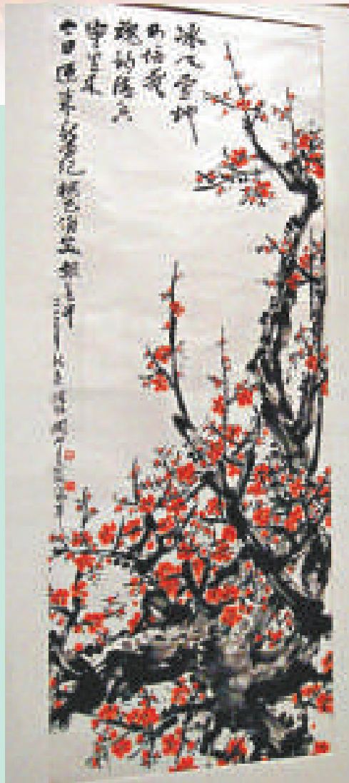
▲關山月作品《梅花俏笑報春開》