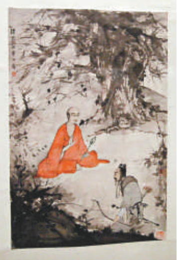
▲傅抱石作品《石勒問道圖》