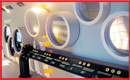
▲二樓的「策略性基建設施」以鋼管配合樓層主題