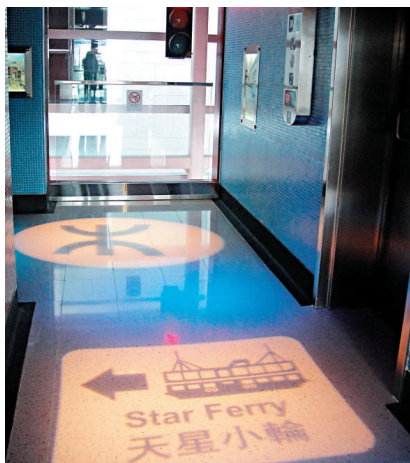
▲館內各式設施使觀眾身臨其境

「展城館」前身為「香港規劃及基建展覽館」，經過翻新及重新規劃，現為高五層、每層面積佔地逾三千平方米的展覽館。展館以不同主題、透過多個展覽區中互動有趣的設施、多段可選播通話、粵語及英語的介紹短片，及置於各處的主題音箱，讓參觀者可以深入了解香港的發展歷史及不同層面的規劃，