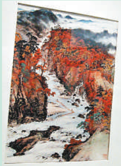
▲關山月作品《秋溪放筏》