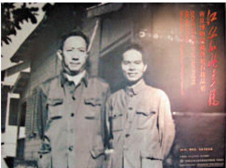
▲關山月（右）與傅抱石五十年前合作大型國畫《江山如此多嬌》

深圳的展覽結束後，將在廣州（廣州美術學院美術館，十月二十五日至十一月四日）和北京（中國美術館，十一月十八日至十一月二