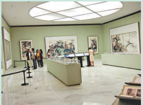
▲觀眾仔細觀賞展品