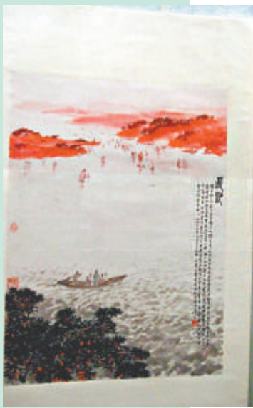
▲傅抱石作品毛澤東《沁園春·長沙》詞意