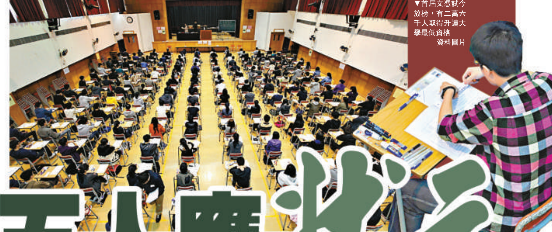
▼首屆文憑試今放榜，有二萬六千人取得升讀大學最低資格 資料圖片