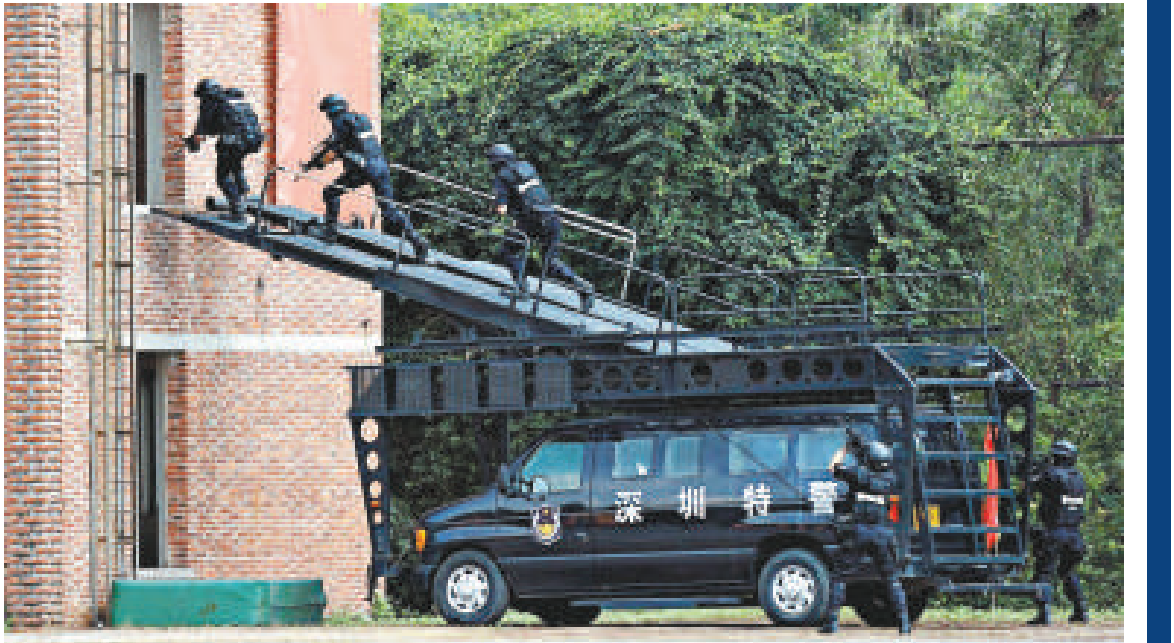
▲19日，廣東公安特警在廣州演練反恐怖襲擊、打擊嚴重暴力犯罪的能力，特警借助攀登車突破進攻

這篇以《維穩的「治標」和「治本」》為標題的文章說，一些矛盾問題發生了，是僅僅治標，以求一時之穩，還是標本兼治，徹底化解矛盾？這是兩種不同的工作思路。有些地方，只看結果，不講