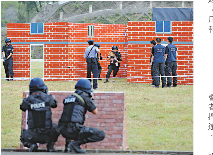
▲特警演練從「劫持犯」手中救出被劫持「兒童」

截至目前，廣東省公安特警累計出動警力150萬人次，直接參與處置群體性事件4000多宗，執行大型活動安保、警衛、安檢排爆任務1.7萬次；直接參與處置暴力恐怖案件逾300宗，其中處置劫持人質案件133宗，成功解救人員182名；執行任務中抓獲犯罪嫌疑犯5.58萬名。期間在「5·12」汶川特大地震搶險救援、「7·5」事件赴新疆處突維穩、北京奧運會、廣州亞運及深圳大運等一系列重、特大突發任務中表現出色。