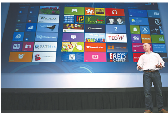
▲微軟 Office 部副總裁柯尼斯鮑爾 16 日介紹最新的 Office 系統