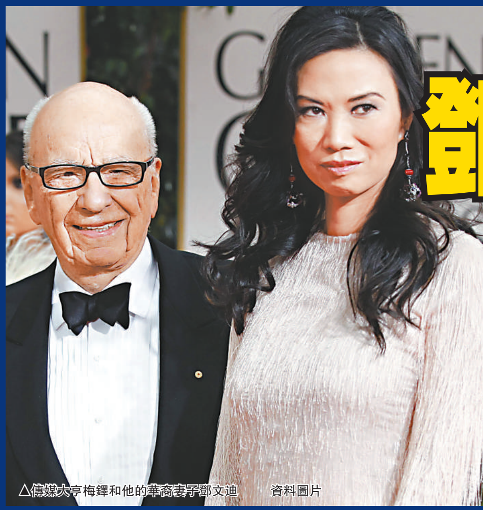
△傳媒大亨梅鐸和他的華裔妻子鄧文迪 資料圖片