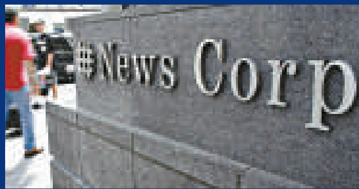
▲新聞集團近期出現了聲譽、法律和監管方面的危機 資料圖片

股東們在信中直言不諱地向這位傳媒大亨表示：「介於新聞集團在英國分支受到電話竊聽和收買警察等指控，集團近期出現了聲譽、法律和監管方面的危機，我們認為，董事會中需要獨立的領導層。」