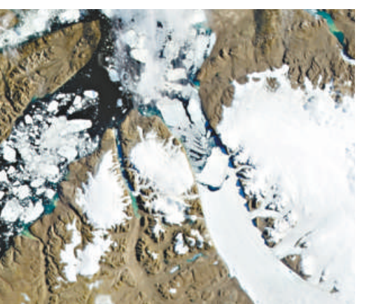
▲一座大型冰山從格陵蘭彼得曼冰川斷裂而出

彼得曼冰川位於格陵蘭島，距離北極點約 1000 公里，是連接格陵蘭島內陸冰原與北冰洋的最大的冰川之一，它的冰舌綿延 70 公里，居全島之最。像其他流向海洋的冰川一樣，彼得曼冰川也有周期性的「冰裂」現象。