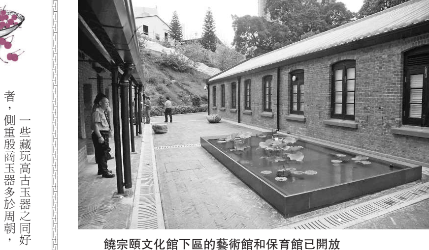
饒宗頤文化館下區的藝術館和保育館已開放