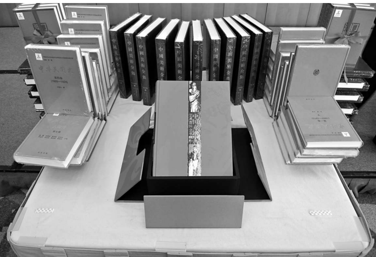
▲國家出版基金贈予港的新書