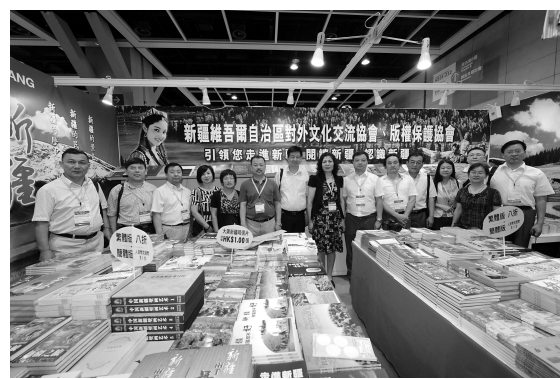
▲新疆代表團於攤位前合影