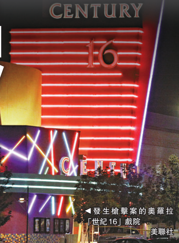
▲發生槍擊案的奧羅拉「世紀16」戲院