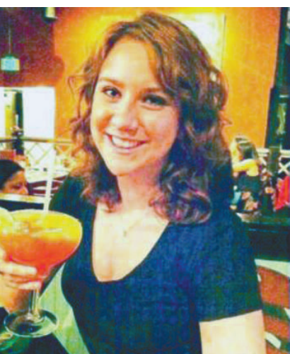
▲體育主播傑西卡·加維不幸在20日的丹佛槍擊案中喪生

【本報訊】據美聯社21日報道：美國丹佛戲院槍擊案中一名死者，是24歲體育新聞主播兼記者傑西卡·加維，她上月才在加拿大多倫多伊頓商場遇到槍擊案，當時僥倖逃過一劫，但今次卻最終命喪戲院。