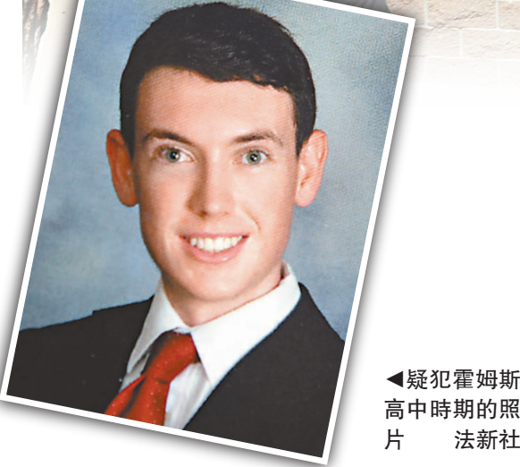
▲疑犯霍姆斯高中時期的照片

【本報訊】據法新社華盛頓21日消息：美國丹佛戲院槍擊案發生之後，外界紛紛猜測疑犯詹姆士·霍姆斯的犯罪動機，有警員出身的威脅評估專家指出，研究這類「大屠殺」案件的動機固然有吸引力，但其真實費心機。