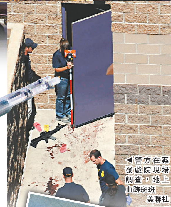
▲警方在案發戲院現場調查，地上血跡斑斑