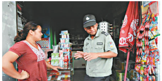
▲「洋城管」在安徽合肥市作為志願者體驗城管工作 網絡圖片