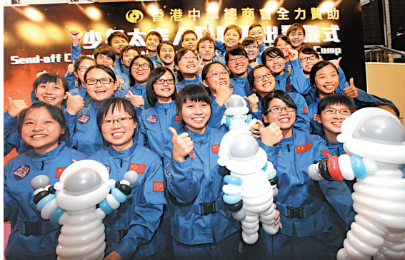
▲三十名獲選中學生將於明日出發前往北京和酒泉參與為期七天的活動

連納智一年前接替上任僅五個月就辭職的謝卓飛，執掌西九文化區管理局，先後與三位政務司司長打過交道。連納智表示，正與政務司司長林鄭月娥保持很好的溝通，兩星期前才見過她，他指林鄭月娥對建築很感興趣，亦十分關注西九未來發展的議題。