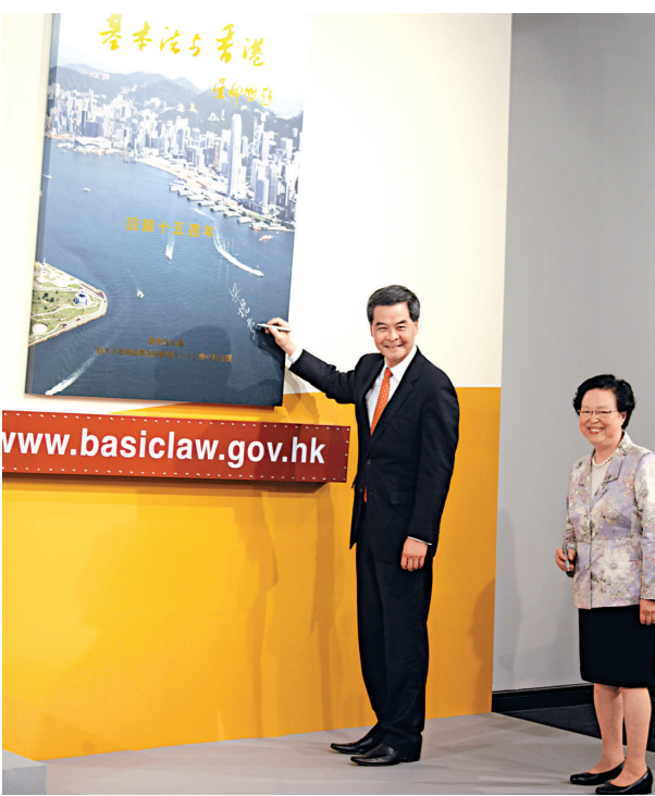
▲《基本法與香港 回歸十五周年》面世，特首梁振英出席新書發布儀式，右為譚惠珠

【本報訊】記者汪澄澄、實習記者王蕙報導：《基本法與香港回歸十五周年》新書發布儀式昨日舉行，該書由港區人大代表譚惠珠主編，她希望港人能從書中記錄的歷史體會到親切感，並了解香港在國家發展中扮演的重要角色。出席儀式的行政長官梁振英則表示，《基本法》的內容隨着「一國兩制」的成功實踐不斷豐富，與時俱進。