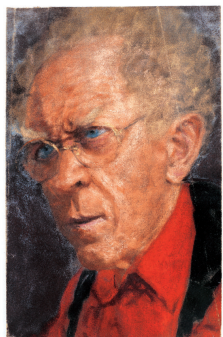
▲阿希加《穿紅色襯衫的自畫像》

本次展覽展出布列松、雷蒙·馬松、阿希加、哈曼、司徒立等法國藝術家的作品約四十件；以及許江、王澐、焦小健等中國藝術家共三十二人的三百五十件作品。該畫展今日最後一天。