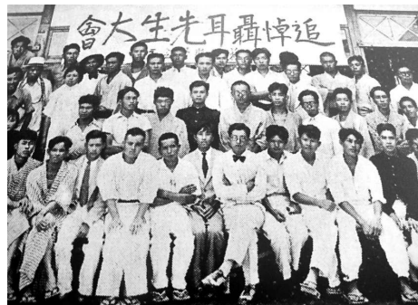
▲紀念聶耳百年誕辰圖片全國巡迴展上的舊照片