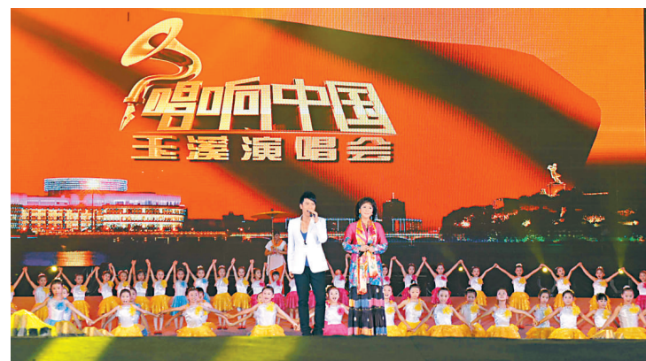
▲紀念聶耳誕辰一百周年演唱會在聶耳音樂廣場唱響