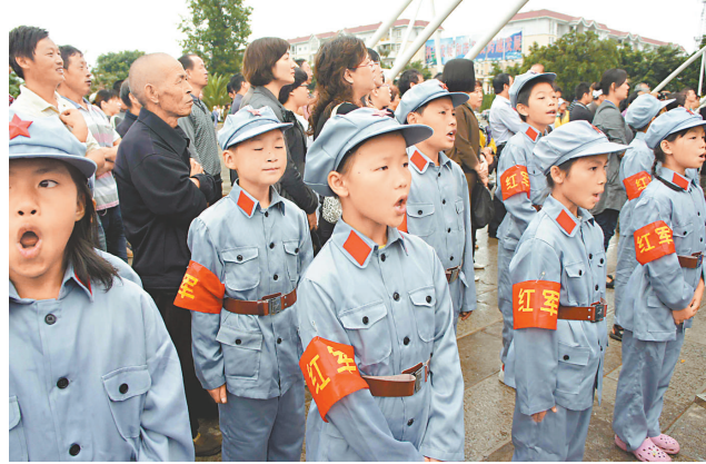
▲玉溪千人同唱國歌，紀念聶耳誕辰一百周年