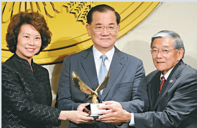
▲連戰出席美國國際領袖基金會年度頒獎典禮並領取「領袖和平獎」。圖左為美國前勞工部長趙小蘭，圖中為連戰。

連戰偕同夫人連方瑛親臨現場，在二〇一二年國際領袖基金會周年晚宴上，從美國前勞工部長趙小蘭手中接受「領袖和平獎」。連戰在發表講話時指出，陳水扁政府自二〇〇〇年上台之後，推行徹底的「法理台獨」，導致兩岸關係緊張