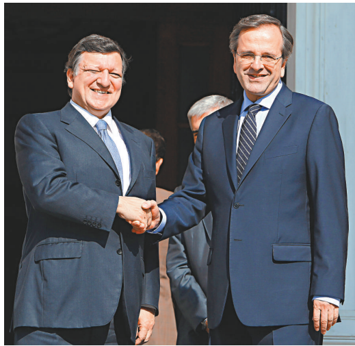
▲歐盟委員會主席巴羅佐（左）催促希臘總理薩瑪拉斯履行此前的承諾

希臘政治領導人向未就115億歐元預算削減方案達成協議；同時，由歐盟、國際貨幣基金組織（IMF）以及歐央行組成的國際債權人三頭馬車，已經開始評估希臘財政改革的進展情況，這將對歐元區的前景產生重要影響。