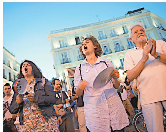
▲西班牙第二季度失業率由前季的24.4%攀升至24.6%，刷新歷史高位

較早前，臉譜因為Facebook擅自更改用戶郵箱設置受到批評，有批評聲稱，臉譜擅自更改用戶郵箱設置是一種霸權行為，目的是推廣其服務，損害競爭對手利益。