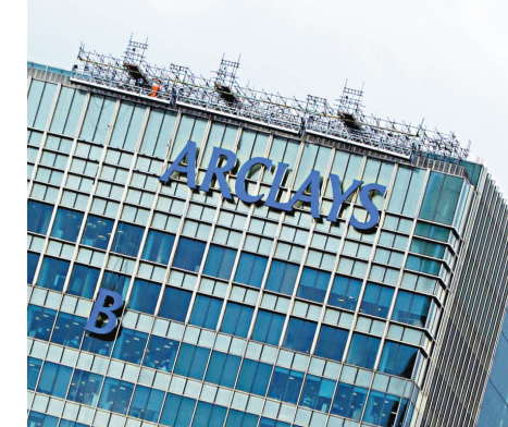
▲巴克萊公布，除稅前盈利升13%至42.3億英鎊，表現勝市場預測