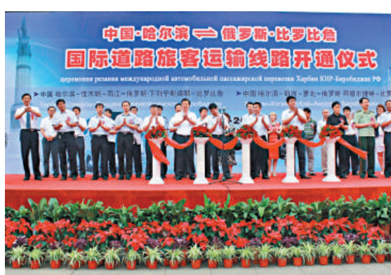
▲中國哈爾濱至俄斯比羅比詹國際道路旅客運輸線路正式開通 本報攝 ▶大巴車正在等待着執行首次跨國運輸任務 本報攝