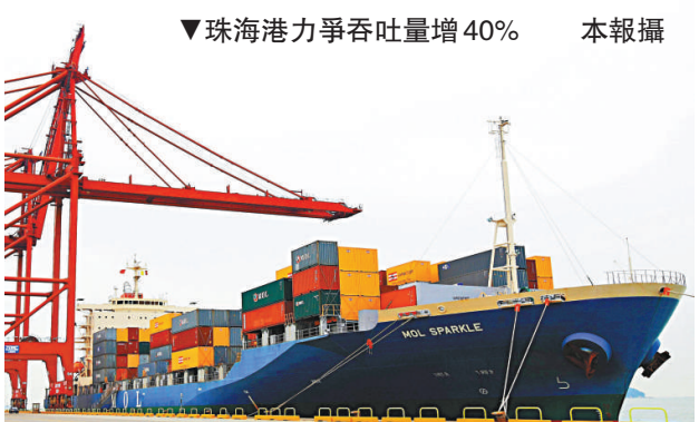
▼珠海港力爭吞吐量增40%

中國神華(01088)公布，擬於9月14日召開臨時股東大會，審議包括在內地發行公司債券，金額不超過人民幣500億元；期限不多於10年。同時，在可發行的額度範圍內，授權董事會發行短期融資券、中期票據、公司債券，以及境外人民幣債券和外幣債券等。