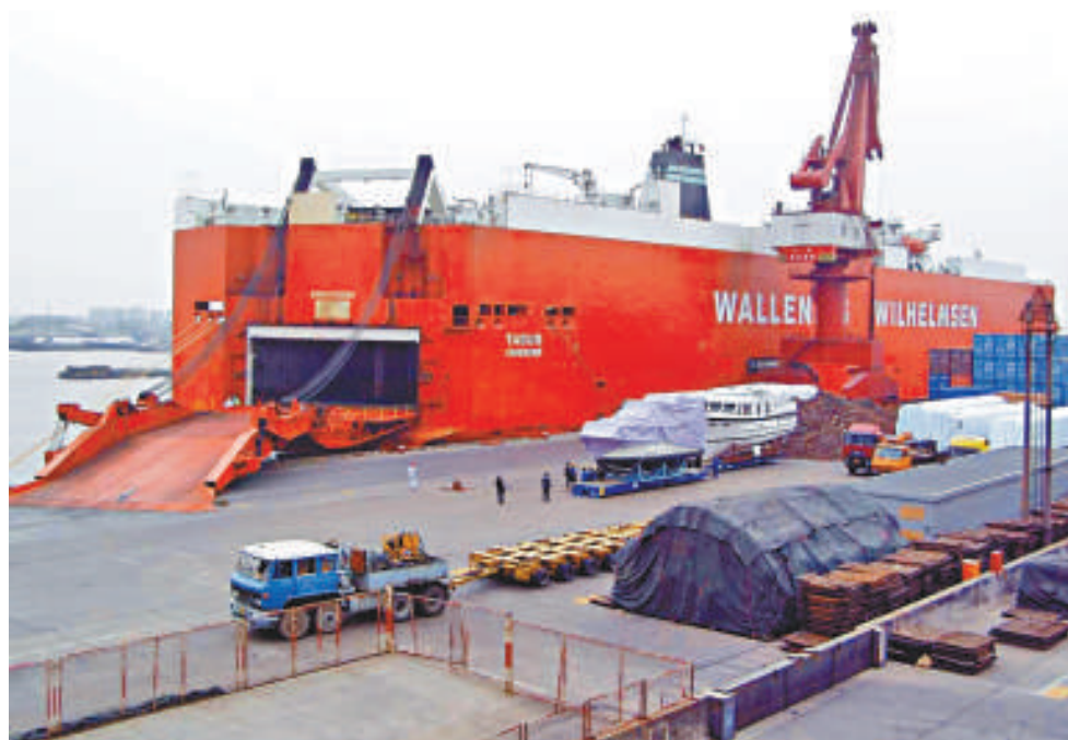
◀日本汽車出口復蘇，滾裝船需求上升，帶動新船訂單量增加

此外，挪威華輪威爾森船務公司(WWL)也將目光放在滾裝船新造市場上，該公司正在設計新一代滾裝船模型，預計2014至2015年投入生產。