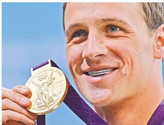
▲美國選手羅切特28日奪得男子400米個人混合泳金牌

當然，雖然奧運金牌已不再是用100%的黃金打造，但是一面金牌在拍賣會上依然可以賣得數十萬英鎊。