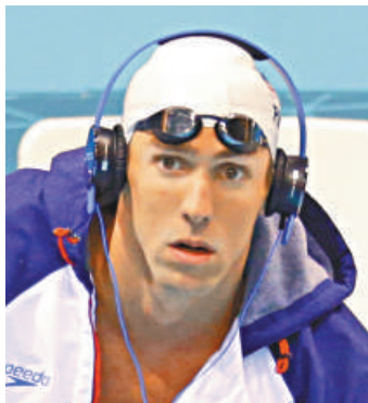
▲7月30日，美國游泳選手菲比斯進行賽前準備

該作用持續時間有多長？按克爾舍的說法，「從幾秒到幾分鐘都可能。」里昂物理實驗室的貝熱龍更明確指出：「在開賽前2分鐘聽池邊音樂，將顯著增加運動員血液含氧量，因此肯定會增加成績。」但他也表示：「我看不出這和公平競賽和誠實競賽有什麼衝突。當然，我不是反興奮劑問題專家。」