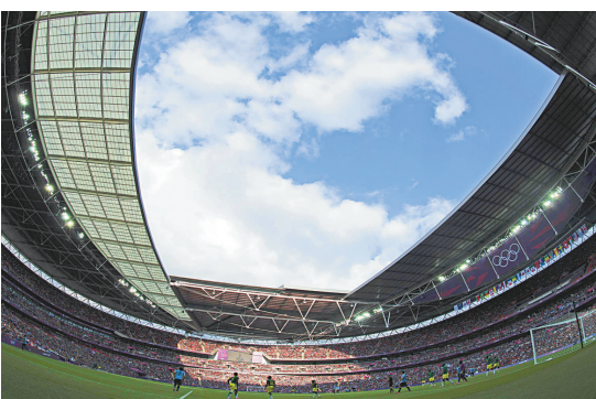
▲負責奧運足球賽事的溫布萊球場

另外，G4S一名保安人員因涉嫌和一名奉命負責奧運射箭項目比賽場地洛德板球場保安的軍人發生口角，而面臨被解僱的命運。G4S發言人指該公司正「趕緊調查」這項指控。