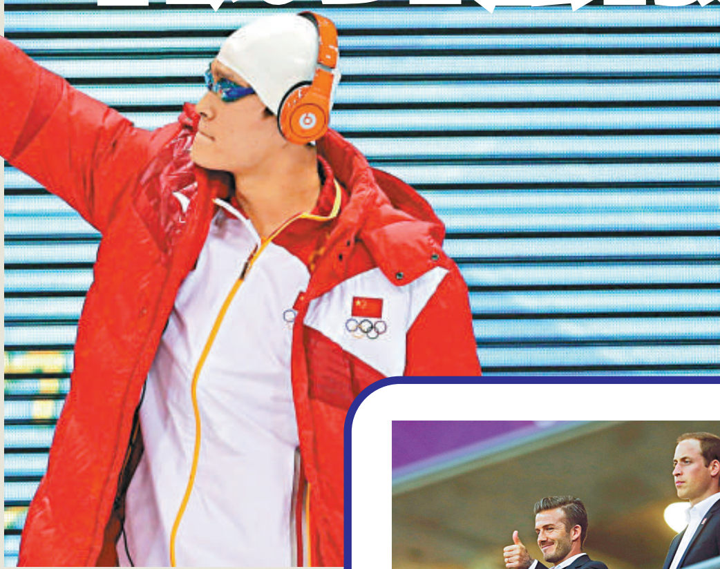
▲7月29日，中國選手孫楊在比賽前亮相

本屆奧運會，當巴西足球隊抵達希羅機場時，大群的球迷在機場迎接他們。但他們大多數戴着耳機，直接從球迷面前走過去。