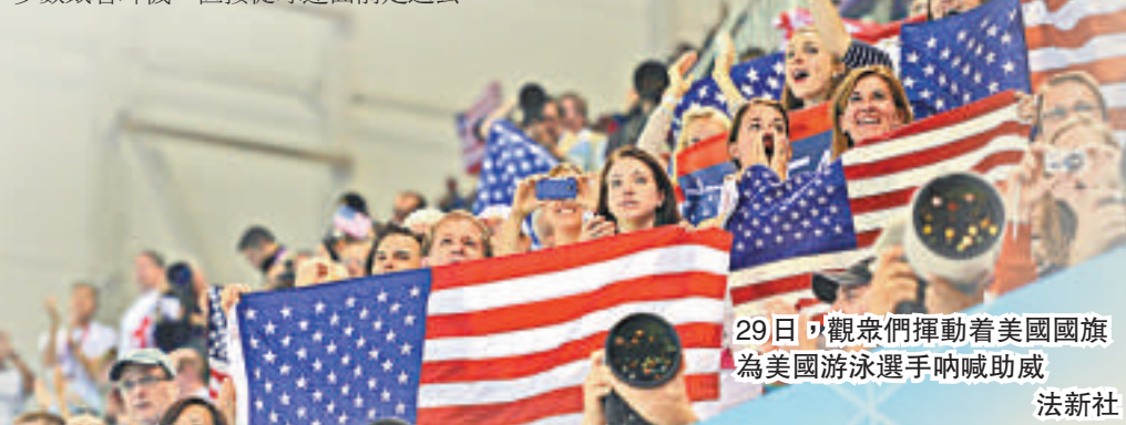
29日，觀眾們揮動着美國國旗為美國游泳選手吶喊助威